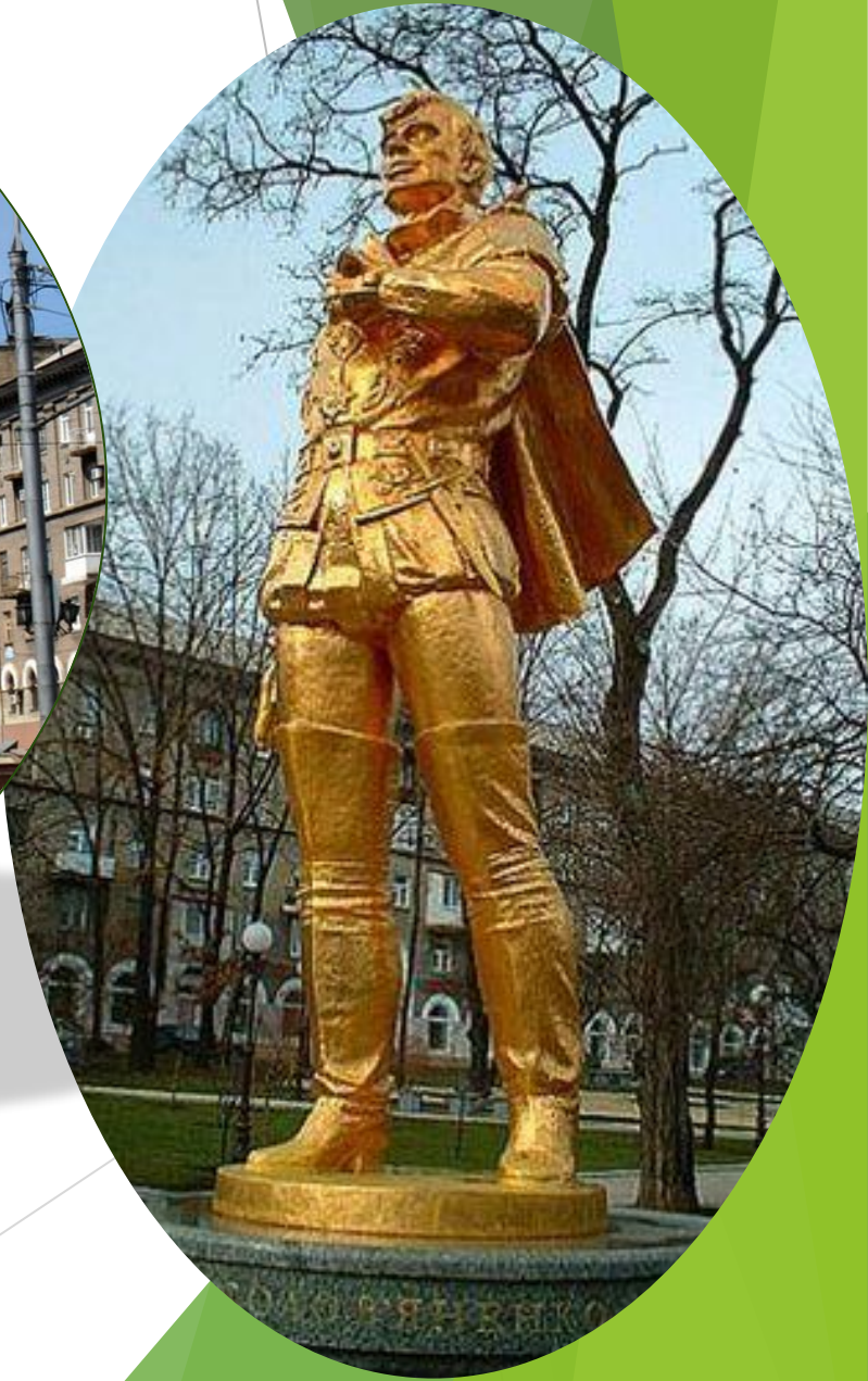
Донецкий государственный академический театр оперы и балета им. А.Б. Соловьяненко