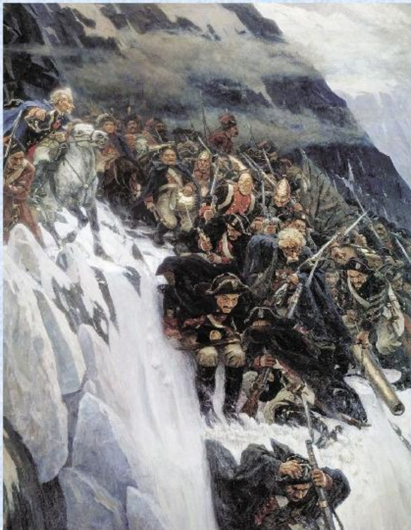
В. И. Суриков. Переход Суворова через Альпы