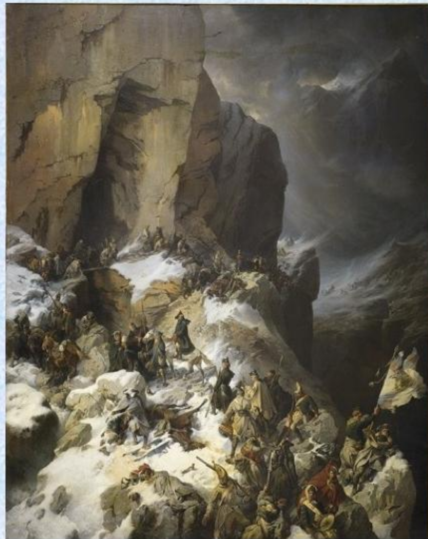
А. Е. Коцебу. Переход русских войск через Паникс в Альпах