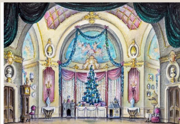
Эскиз декорации к балету П. И. Чайковского «Щелкунчик»