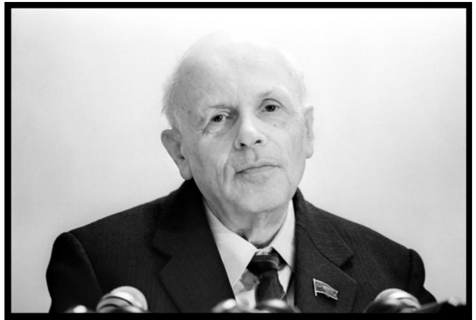
А.Д. Сахаров – физик, создатель водородной бомбы