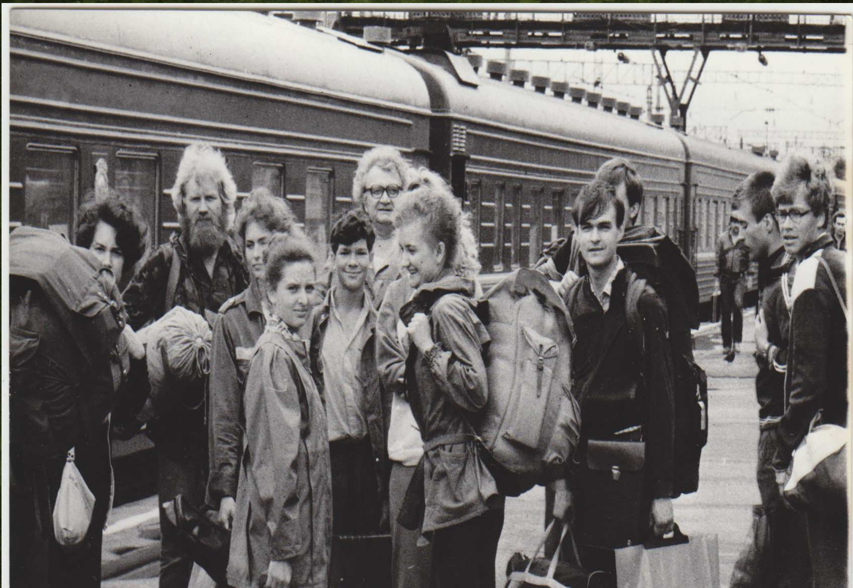
Поисковый отряд «Долг» Вязьма. 1989 год