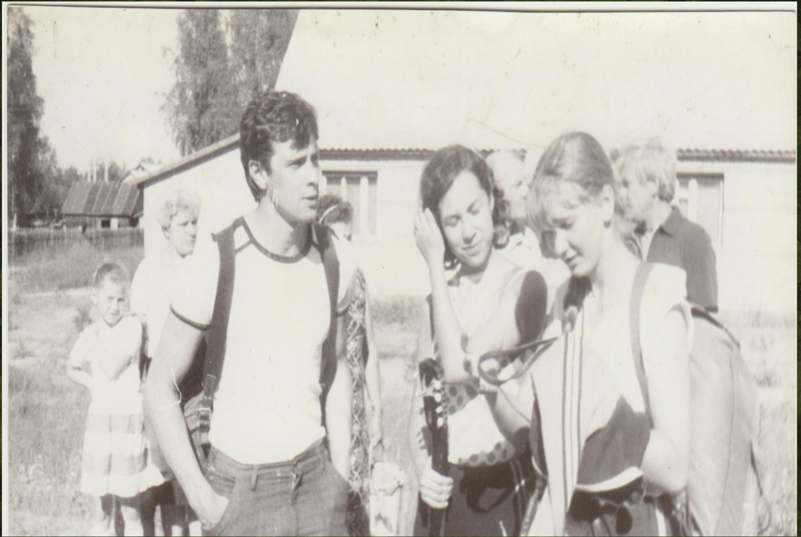
Поисковая группа ГГУ в селе Юшково, июль 1988 года