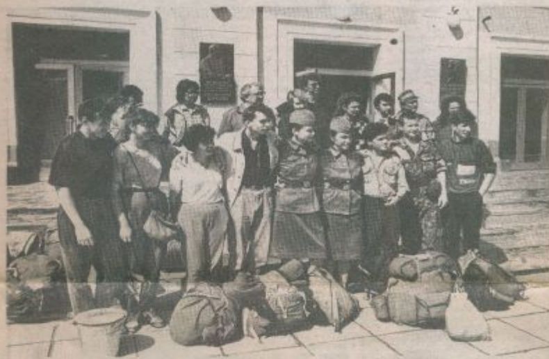
НА СНИМКЕ — поисковый отряд в очирку; сердце

...Когда вы эти строки, от глазе с команд Мясловыми и тверскую земл где наша арми годах вела фашистскими ми и где в пол ти покоятся ост тех наших бой