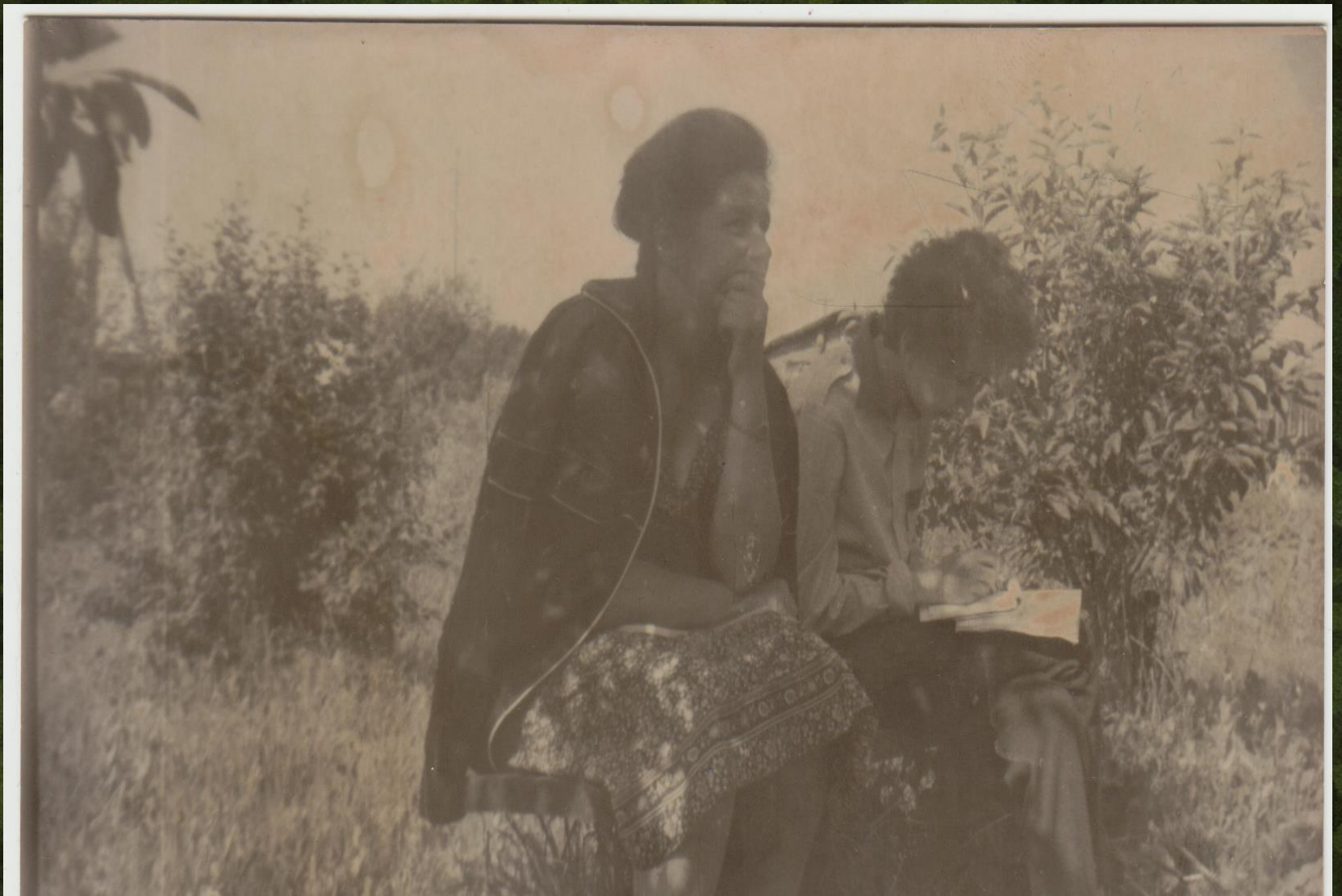
Минуты отдыха. Запись воспоминаний местных жителей