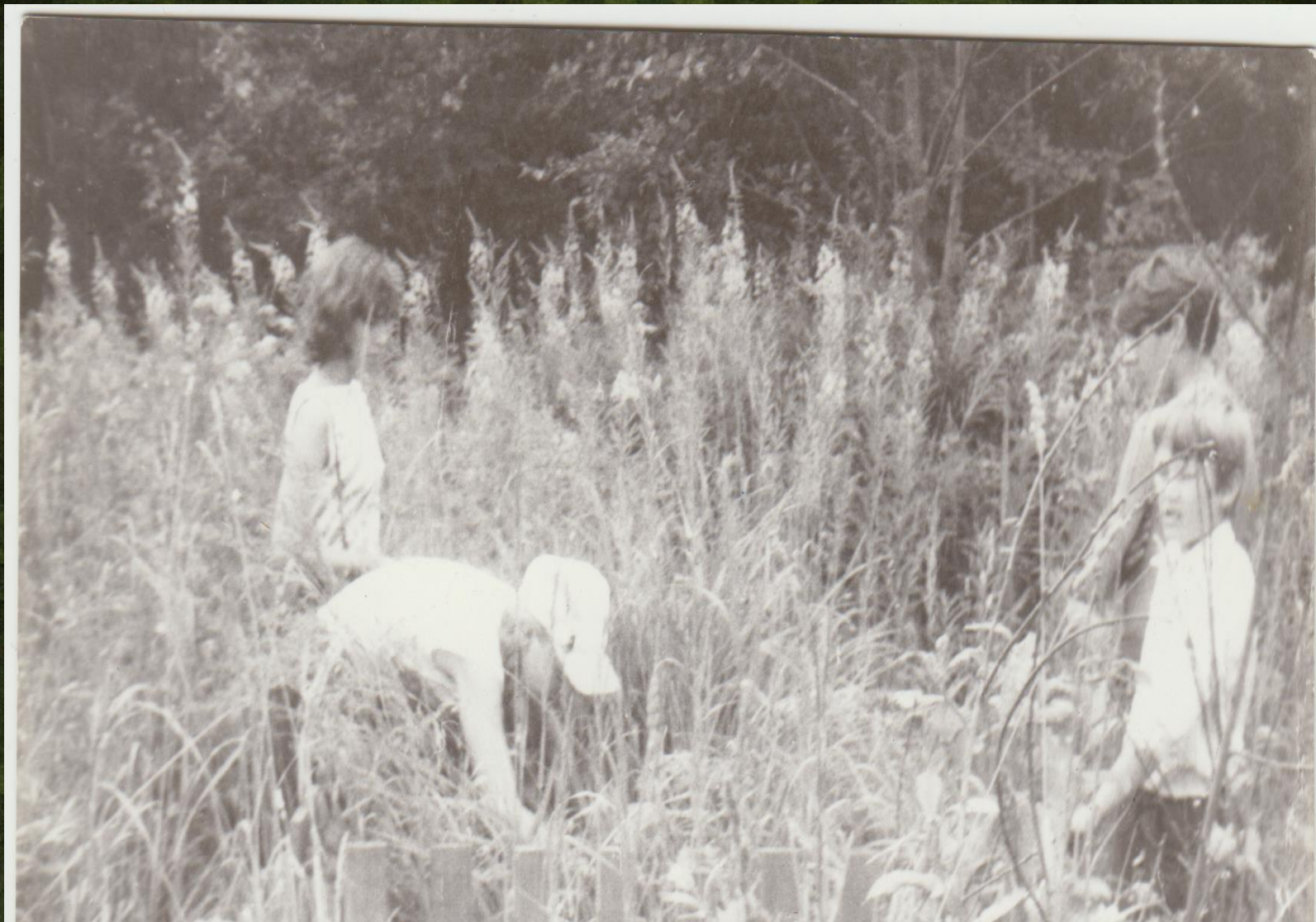
Заброшенные могилы советских солдат