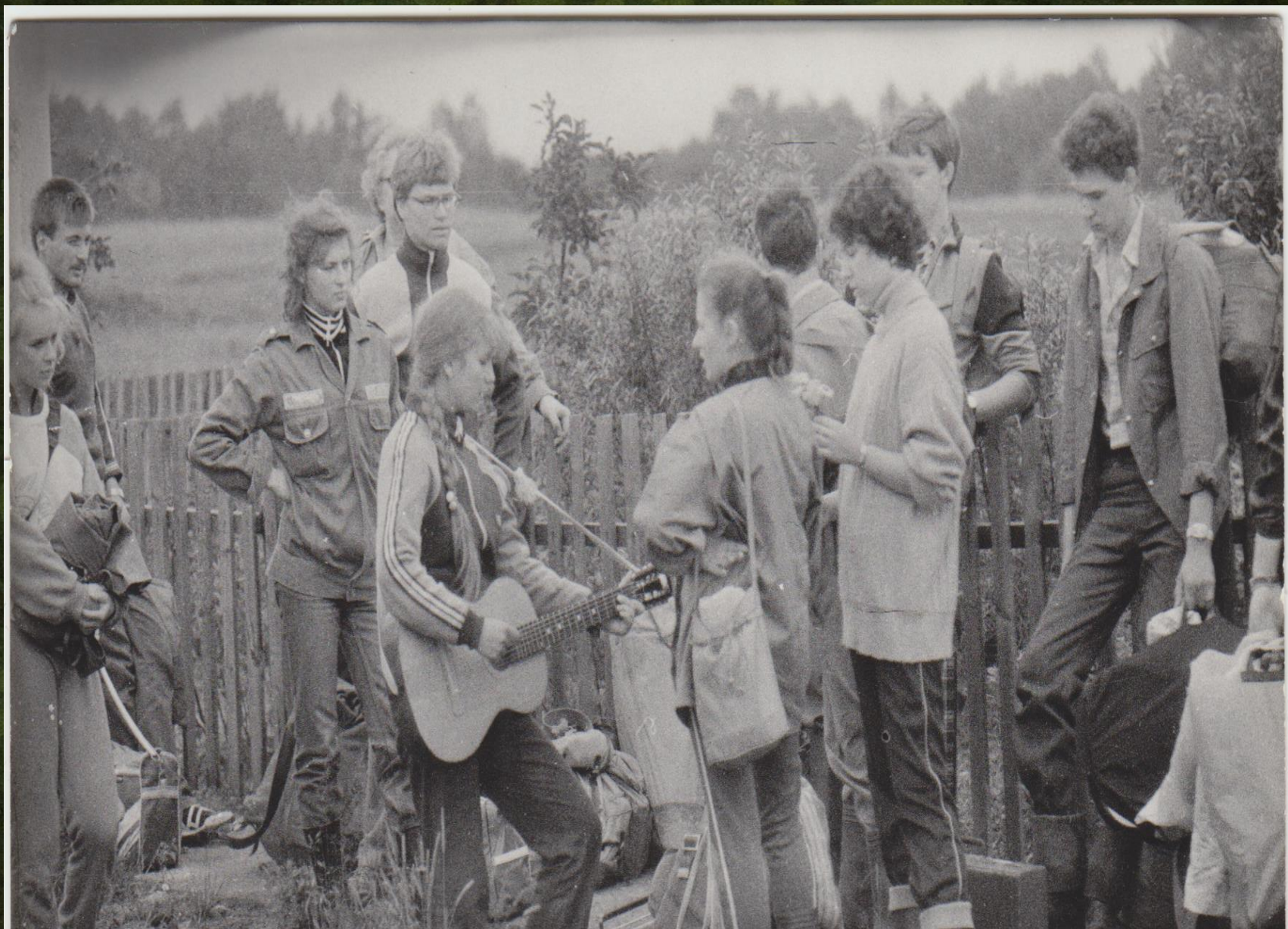
Околица села Юшково