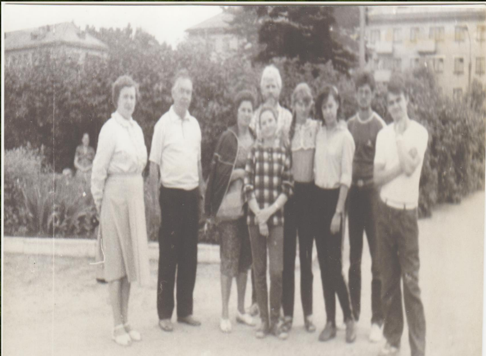
Поисковая группа ГГУ в Вязьме. июль 1988 года