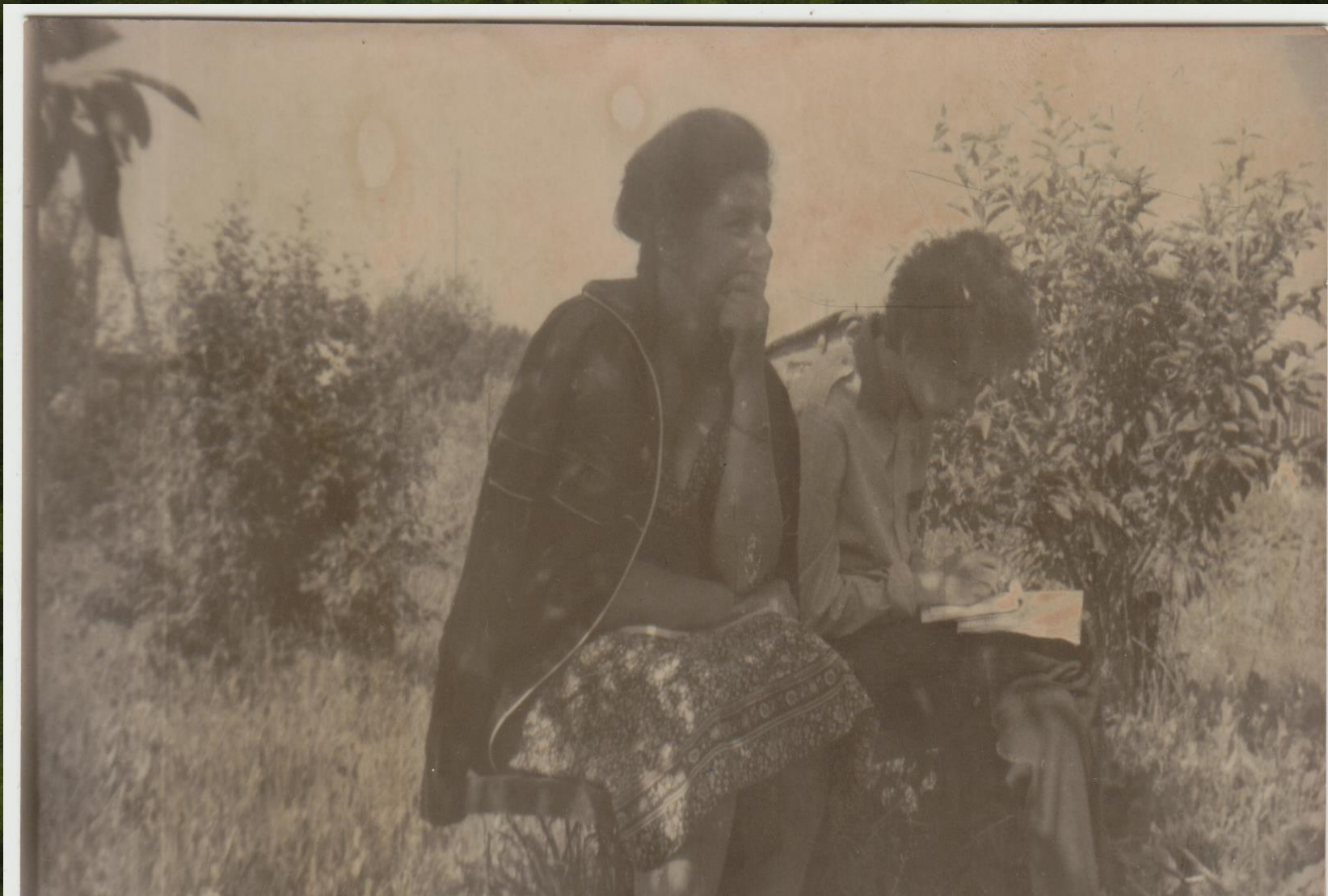
Минуты отдыха. Запись воспоминаний местных жителей