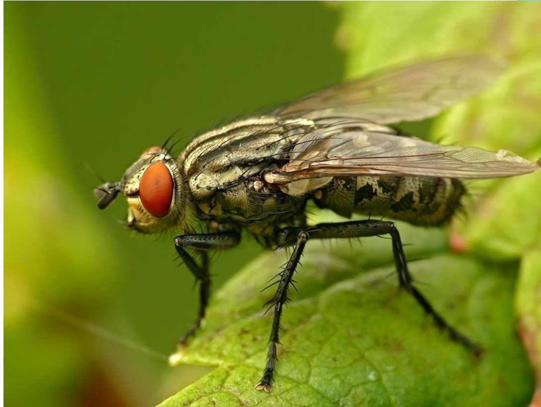
Вольфартова муха ( Wohlfahrtia magnifica ) сем. Sarcophagidae