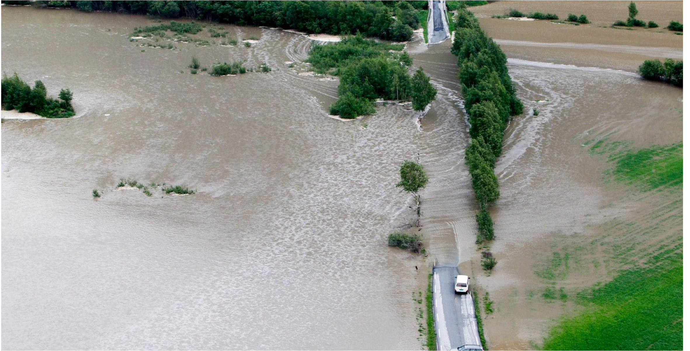
Рис. 1 Опасное гидрологическое явление