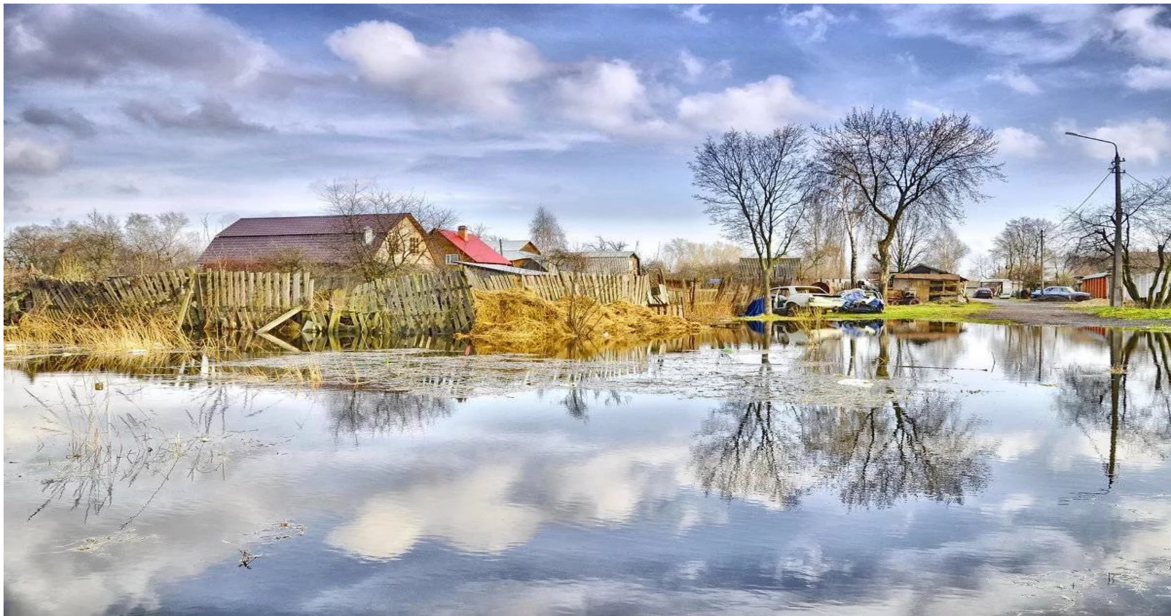
Рис. 5 Паводок