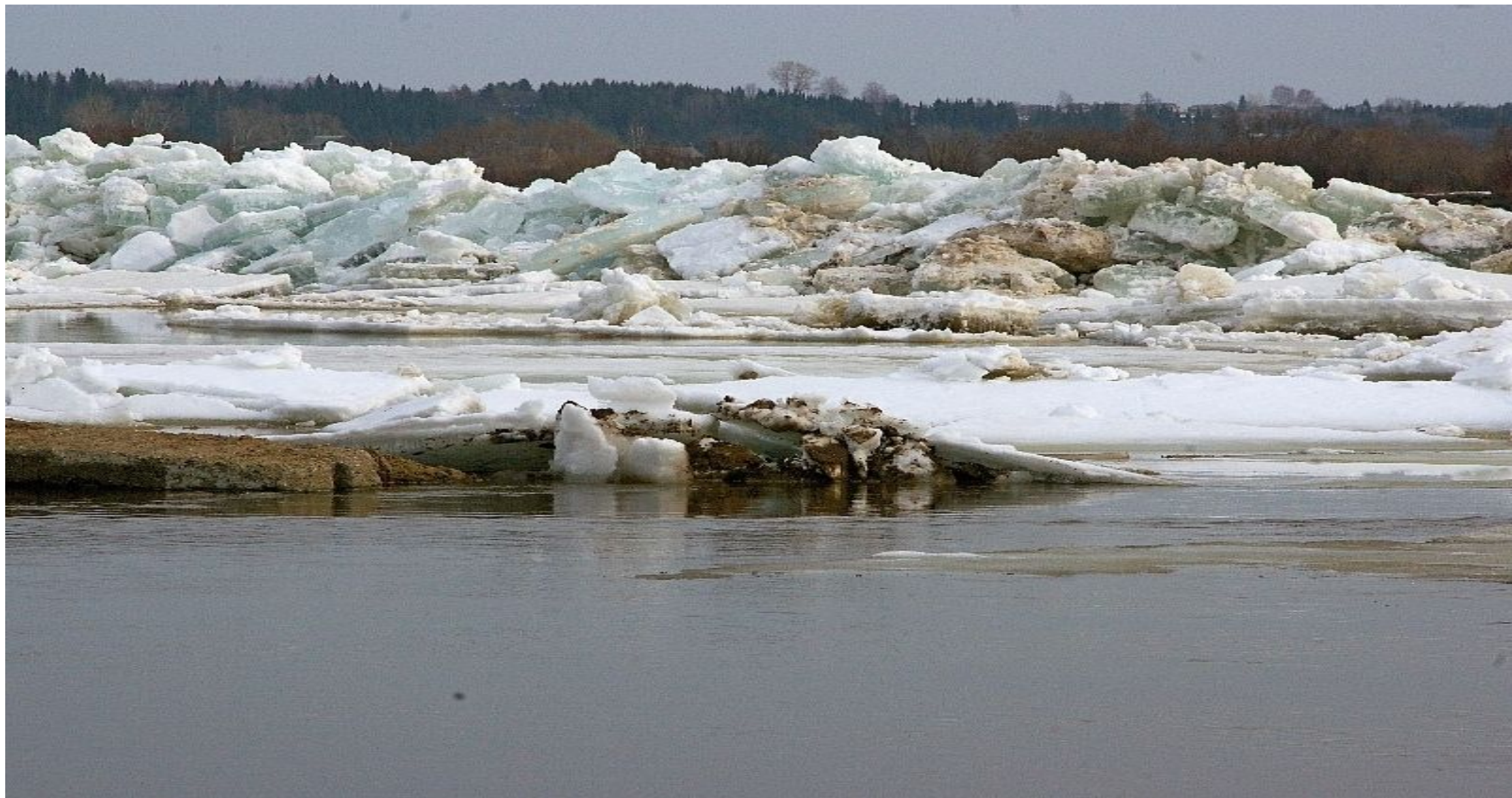
Рис. 3 Затор