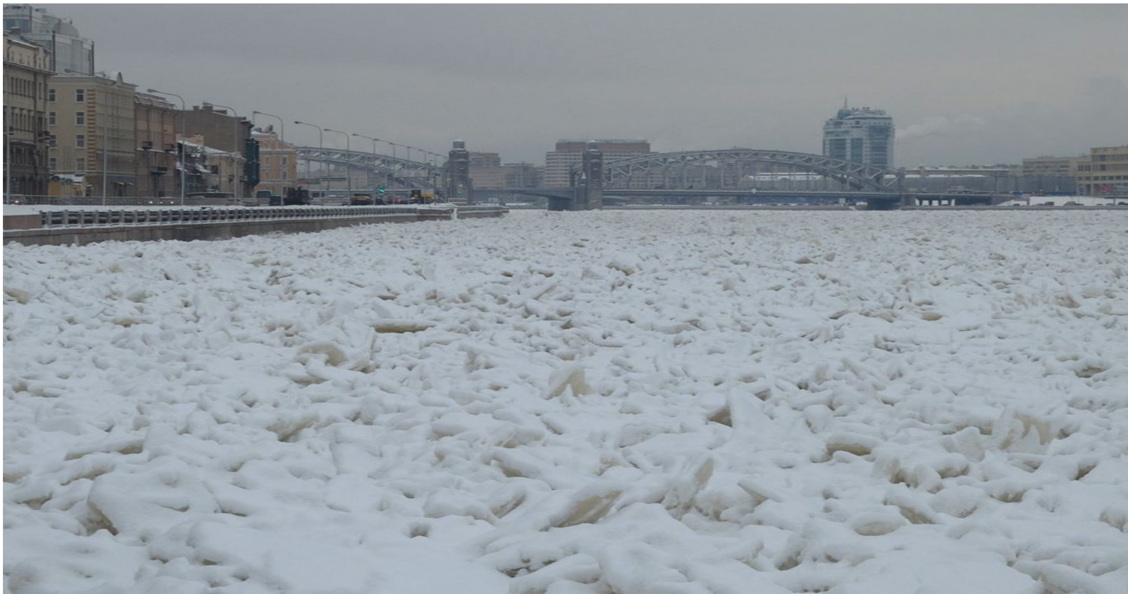
Рис. 4 Зажор