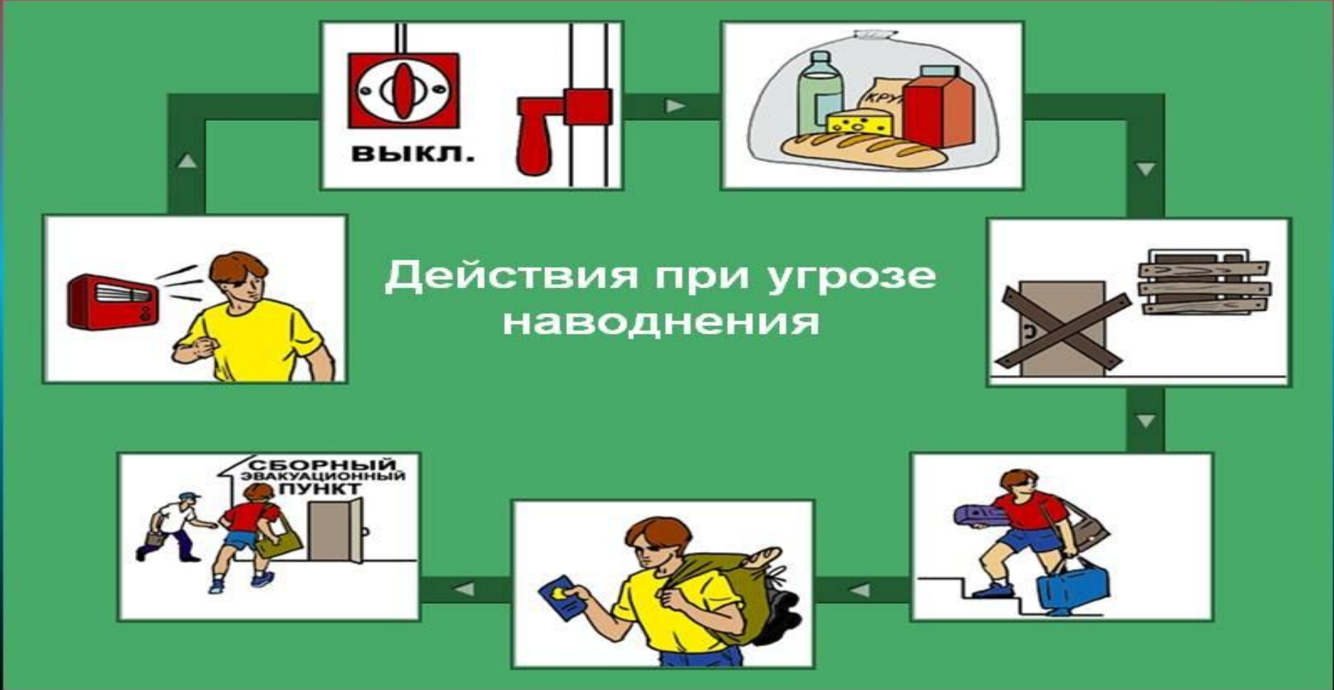
Рис. 7 Действия при угрозе наводнения