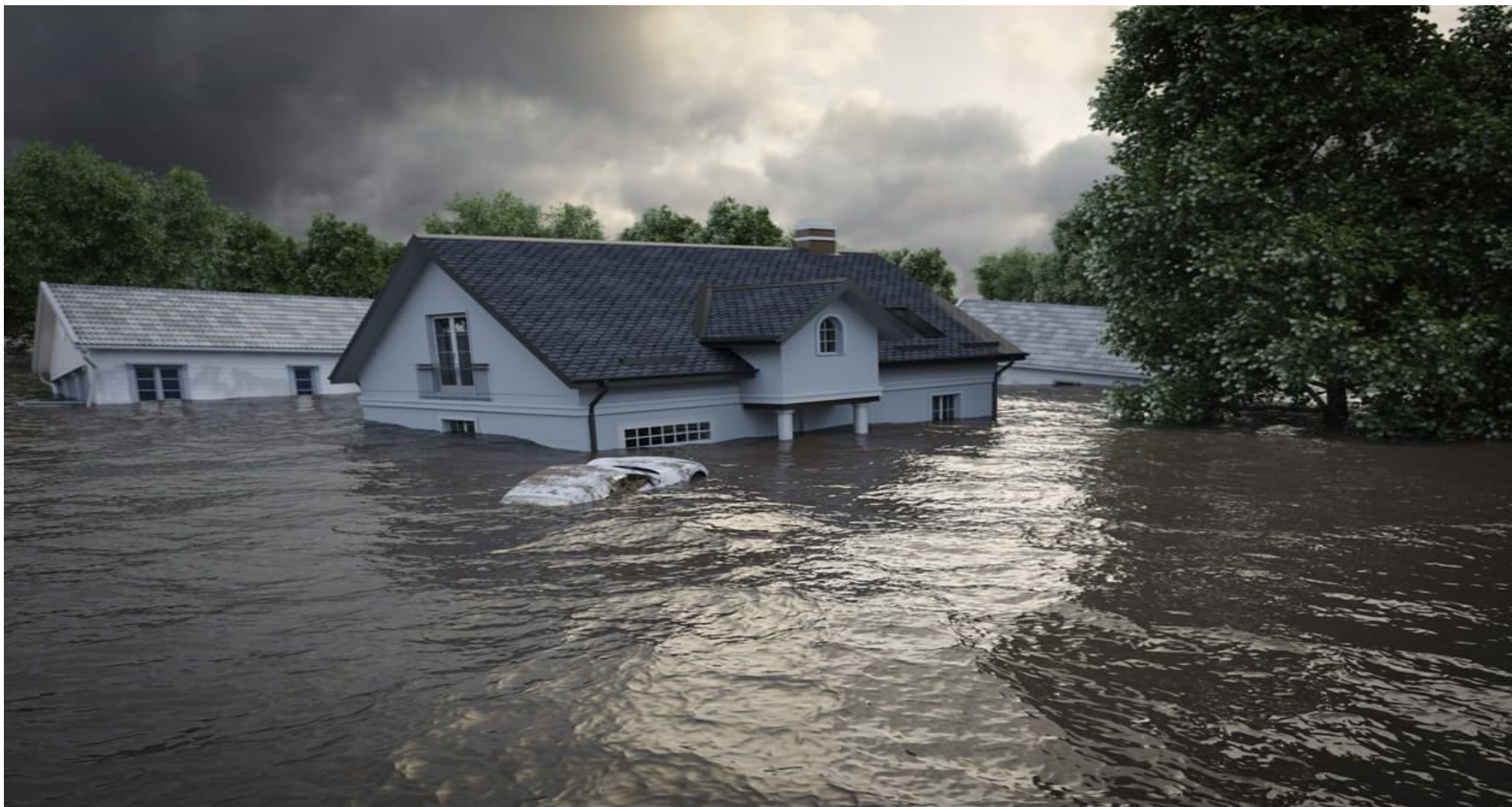
Рис. 2 Наводнение