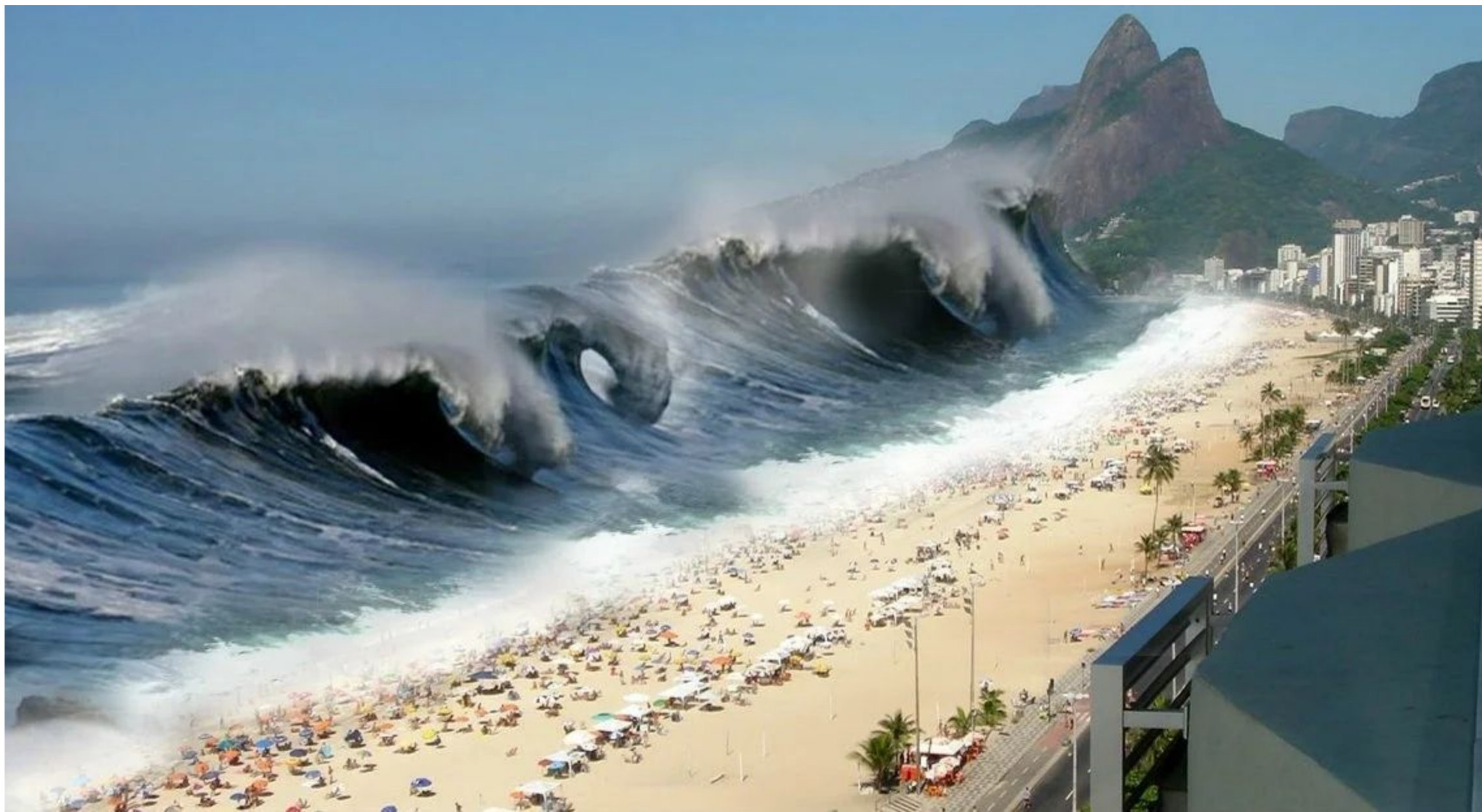
Рис. 6 Цунами