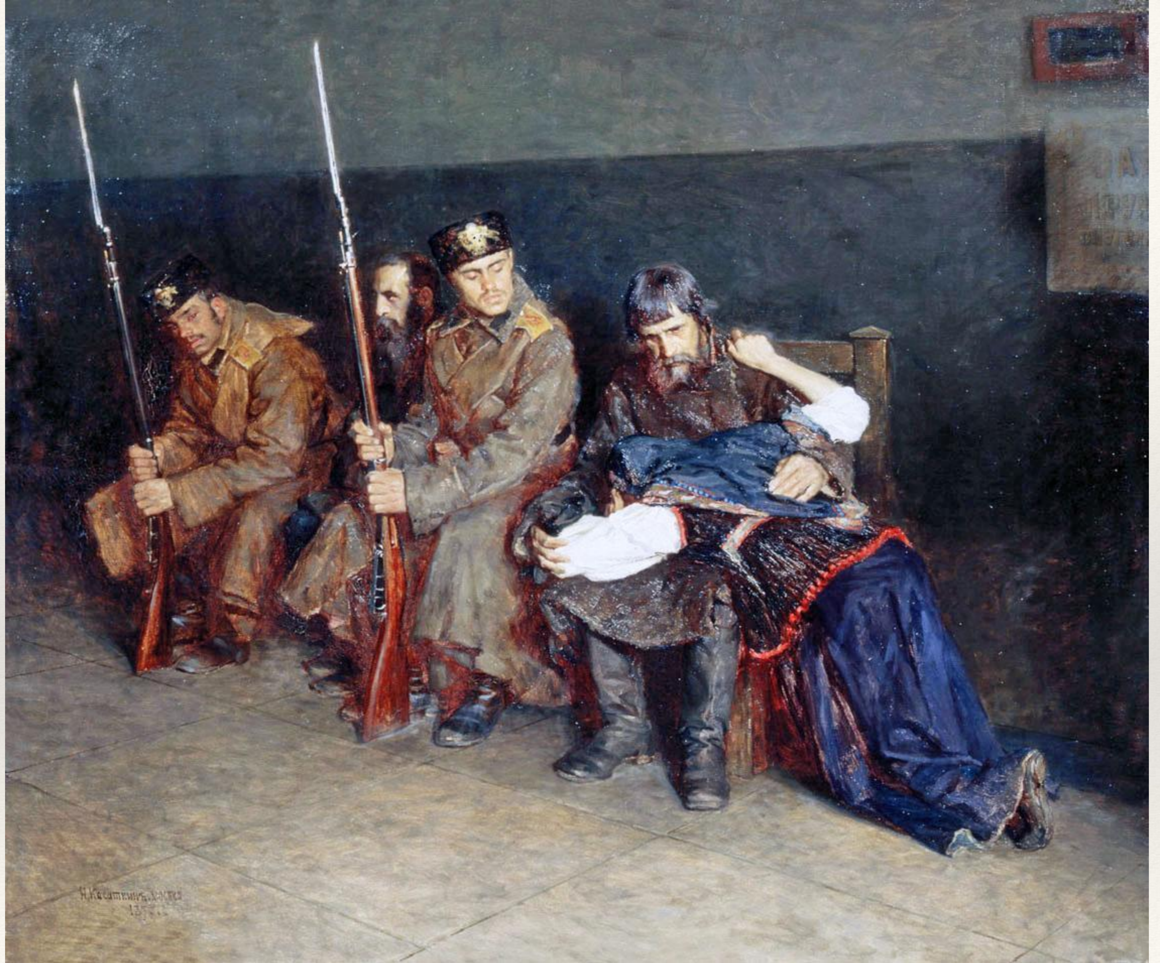
Николай Касаткин. В приемной районного суда. 1897 г.