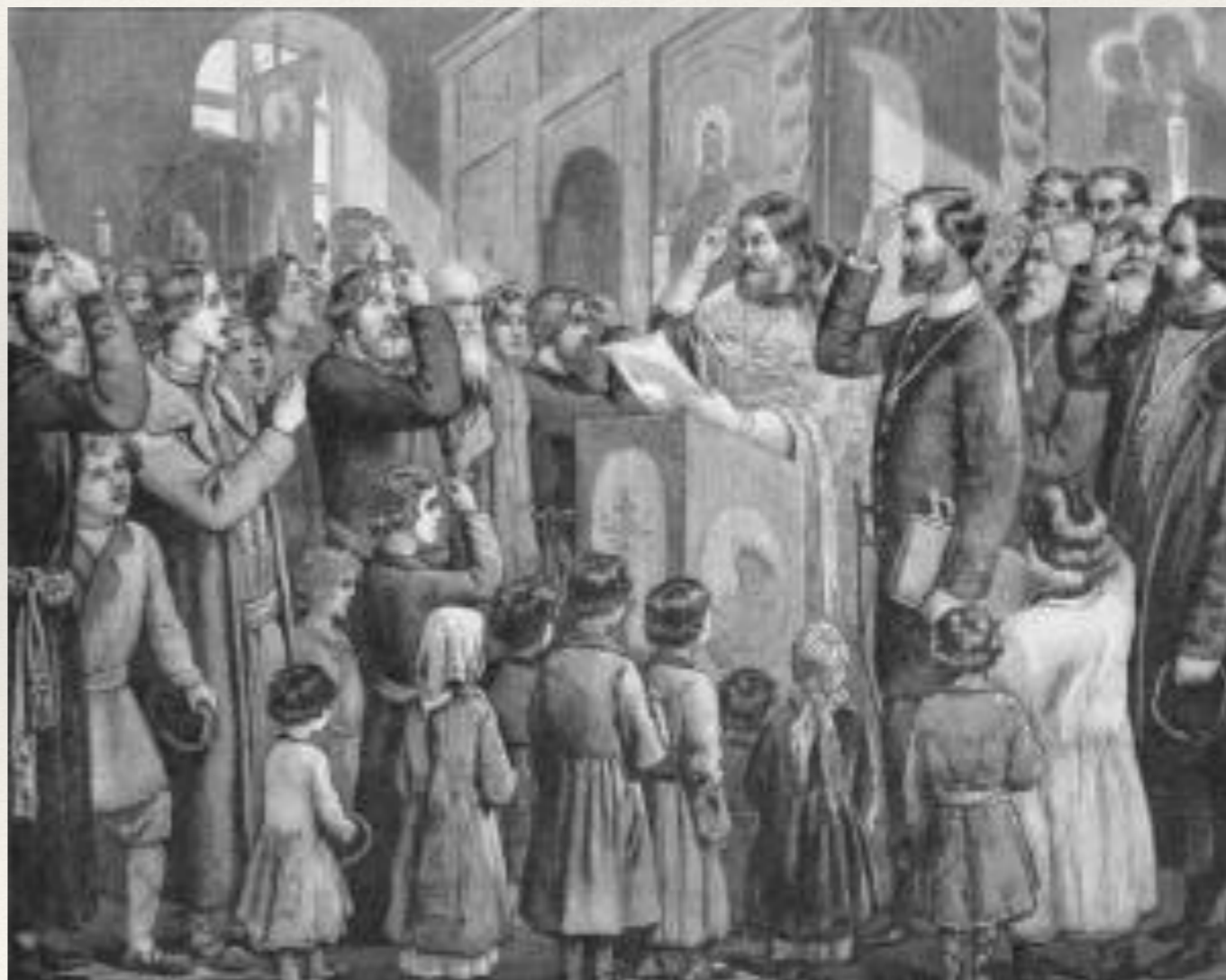
«Чтение Манифеста 19 февраля 1861 года в деревне». (Царствование Александра II). Литография.

Тем не менее необходимо признать, что участие Зарудный в крестьянской реформе было незначительно; он приложил к ней свою руку только тогда, когда основания реформы в существенных чертах были уже выработаны, и приложил ее скорее как защитник выработанных другими начал, чем как человек, самостоятельно их выработывающий.