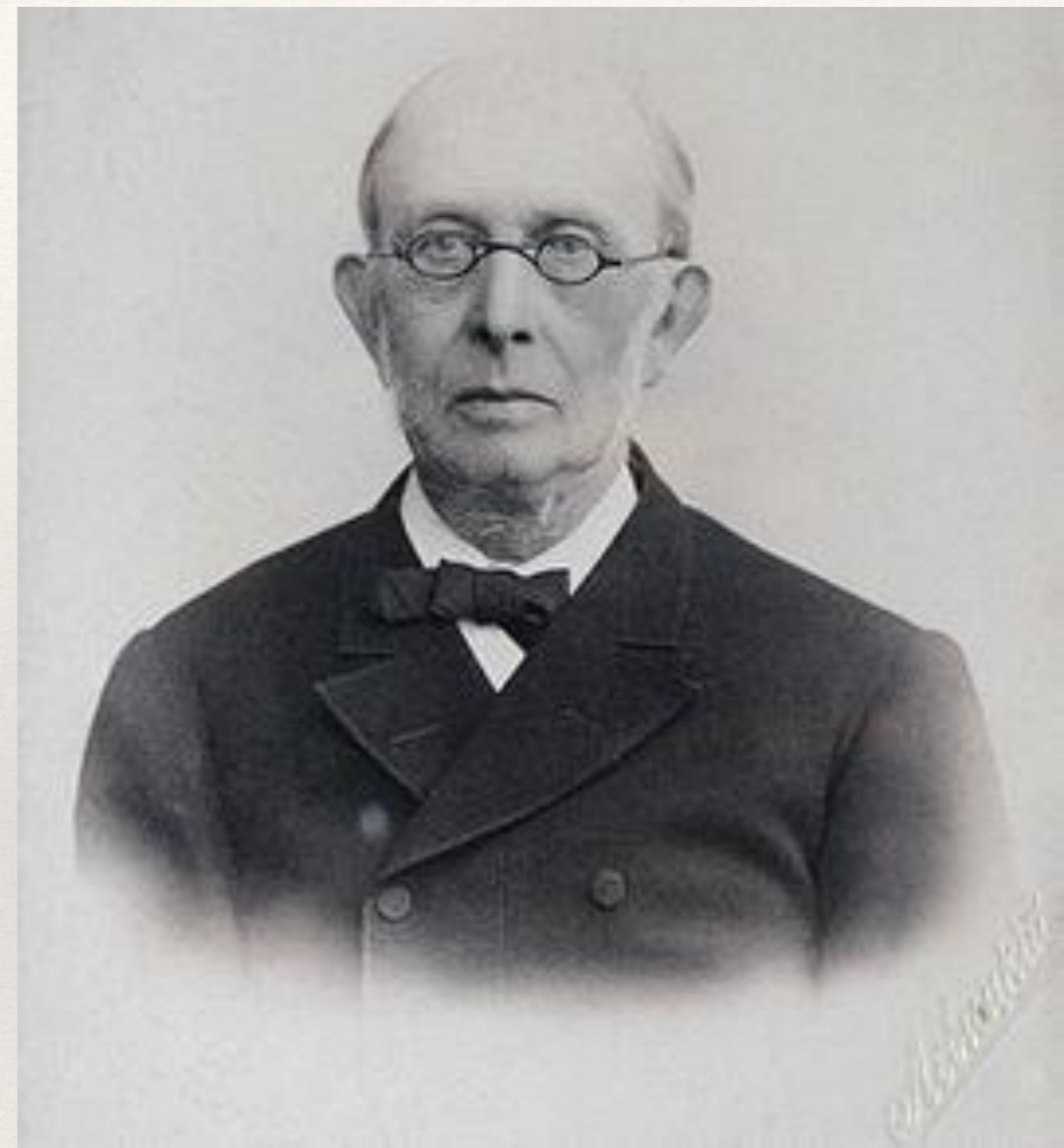
Константин Петрович Победоносцев