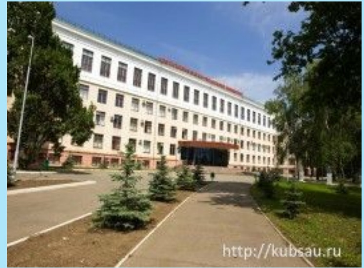
Кубанский Государственный Аграрный Университет