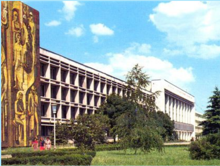
Кубанский Государственный Университет (КубГУ)