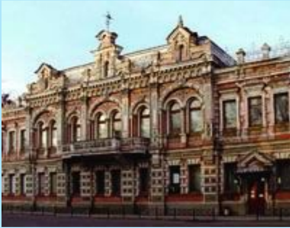
Краснодарский государственный историко- археологический музей- заповедник им. Е.Д. Фелицына