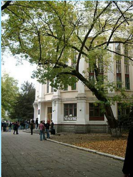
Кубанский государственный технологический университет