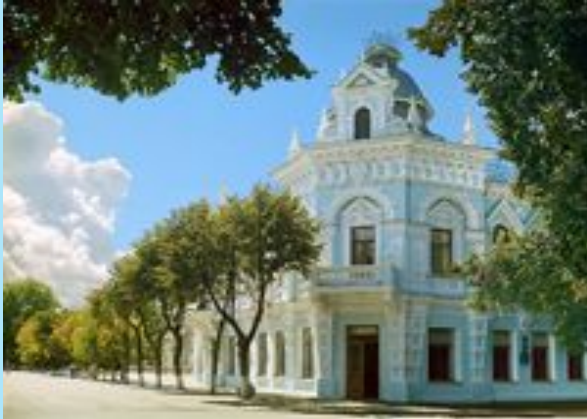
Краснодарский краевой художественный музей им. Ф.А.Коваленко