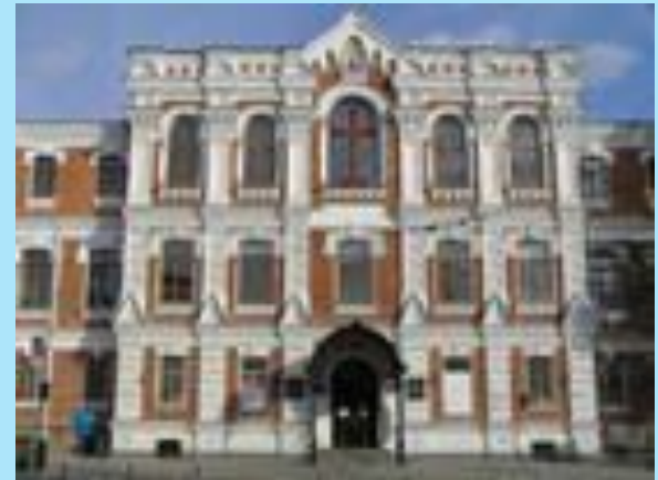
Кубанский государственный медицинский университет