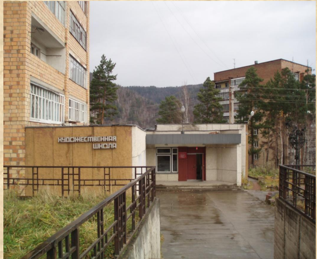
Гордость Дивногорска – детская художественная школа имени Е.А. Шепелевича. Одна из лучших школ края. Ее учащиеся – победители международных конкурсов детского рисунка.