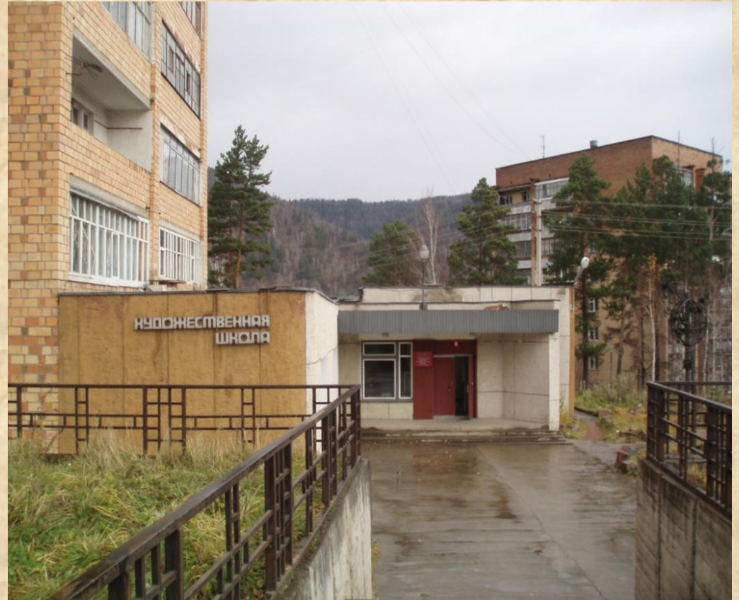
Гордость Дивногорска – детская художественная школа имени Е.А. Шепелевича. Одна из лучших школ края. Ее учащиеся – победители международных конкурсов детского рисунка.