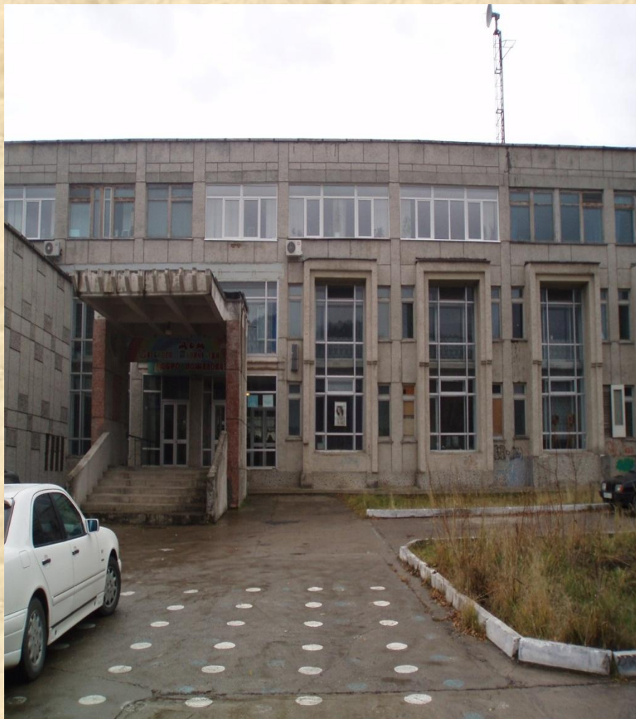
ДОМ ДЕТСКОГО ТВОРЧЕСТВА