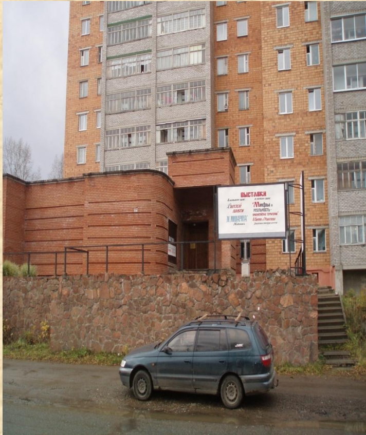
Дивногорский Художественный музей Улица Нагорная