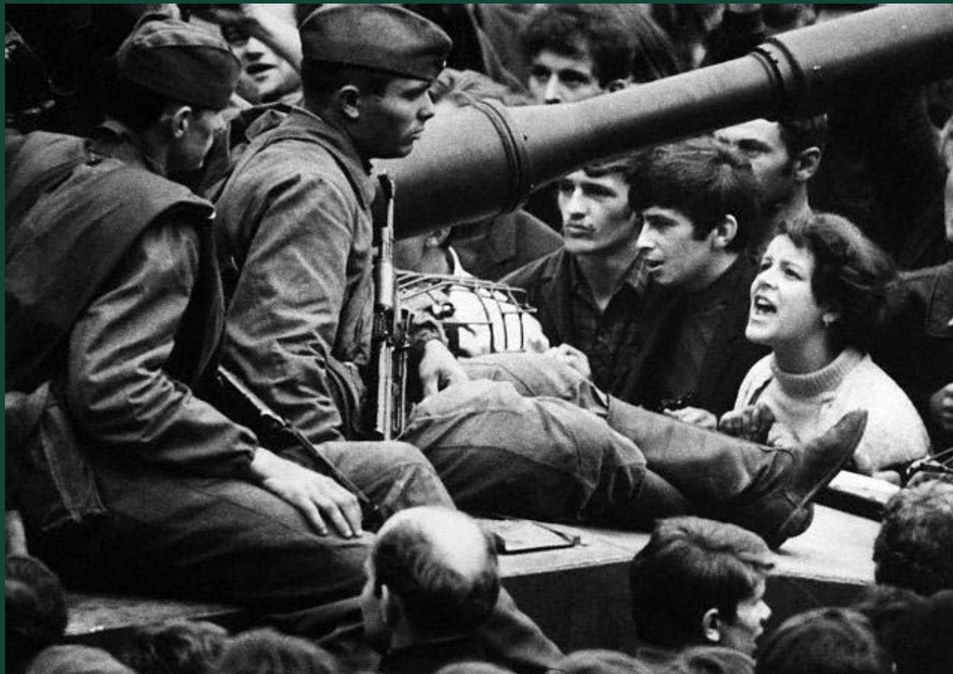
«Пражская весна» 1968 г.