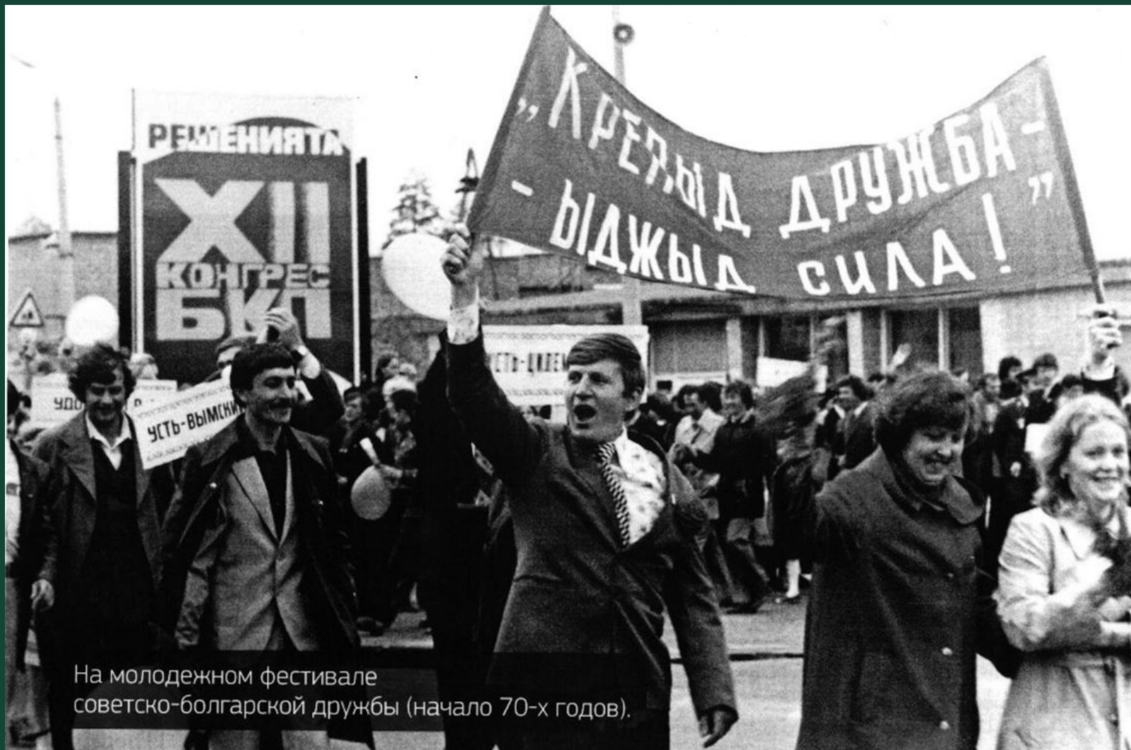
На молодежном фестивале советско-болгарской дружбы (начало 70-х годов).