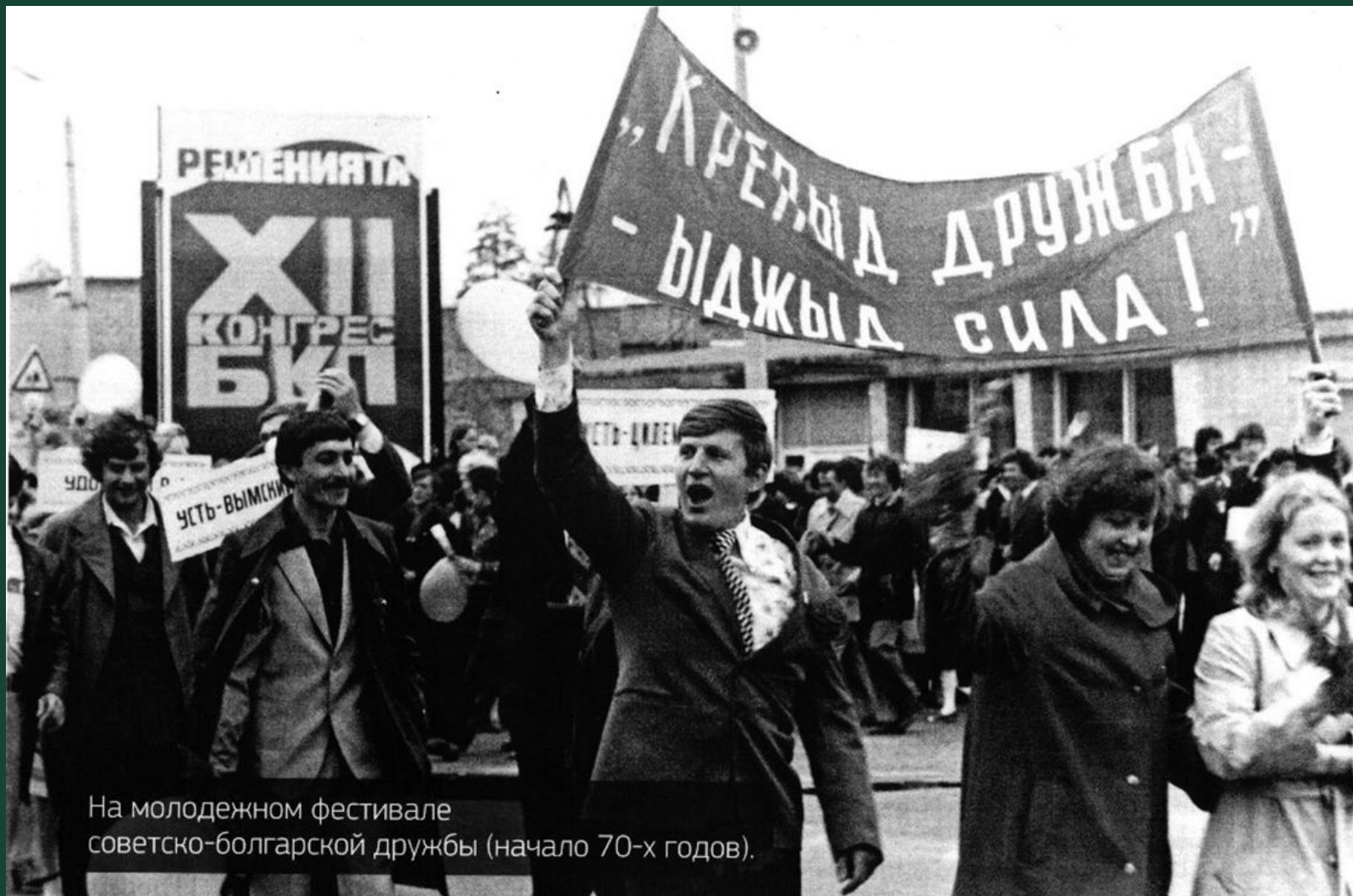
На молодежном фестивале советско-болгарской дружбы (начало 70-х годов).