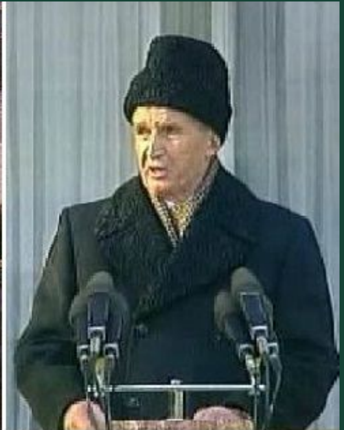
Николае Чаушеску 21 декабря