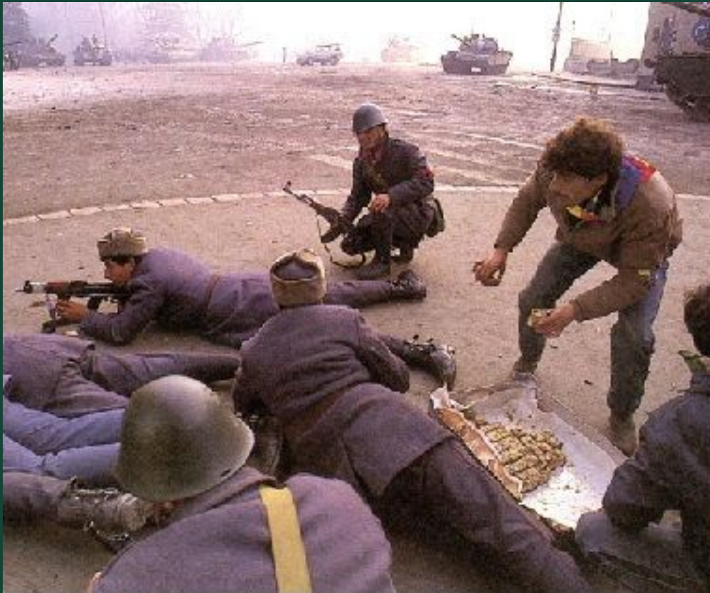
Бои на улицах Бухареста, декабрь 1989 года