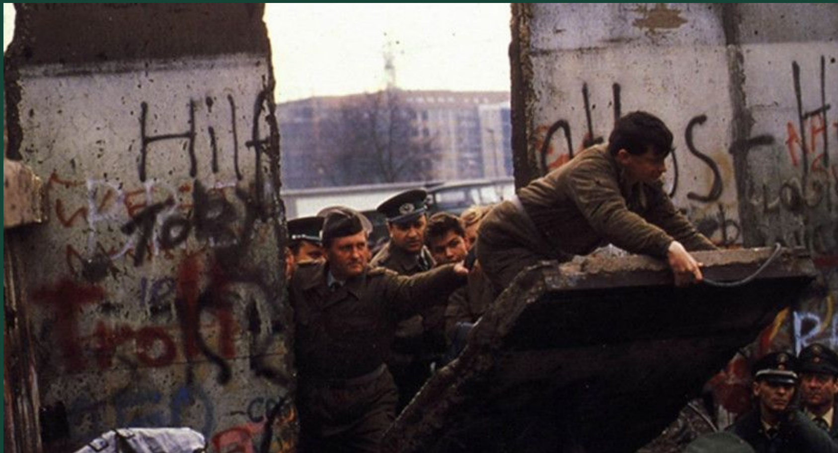
Падение берлинской стены. 1989 год