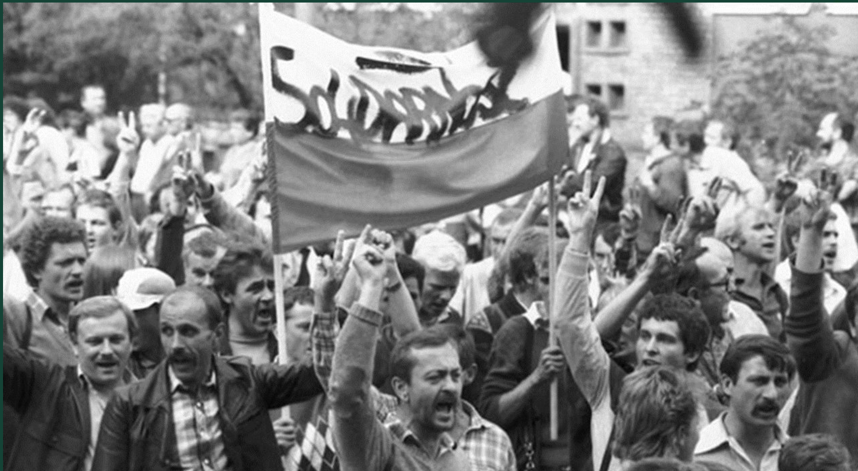
Забастовка на Гданьской судовой верфи. 1988 год