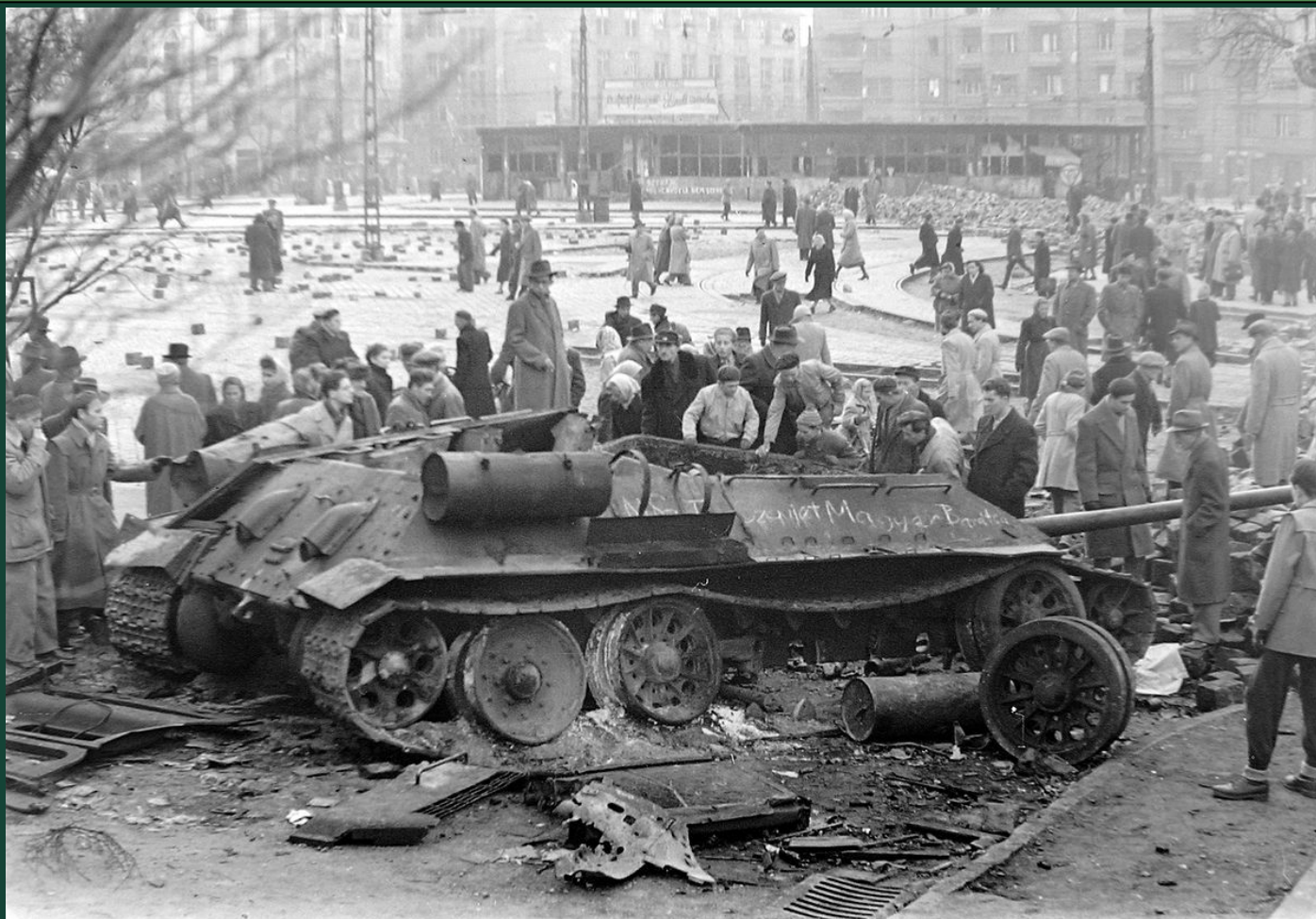
Венгрия 1956 года: народное восстание