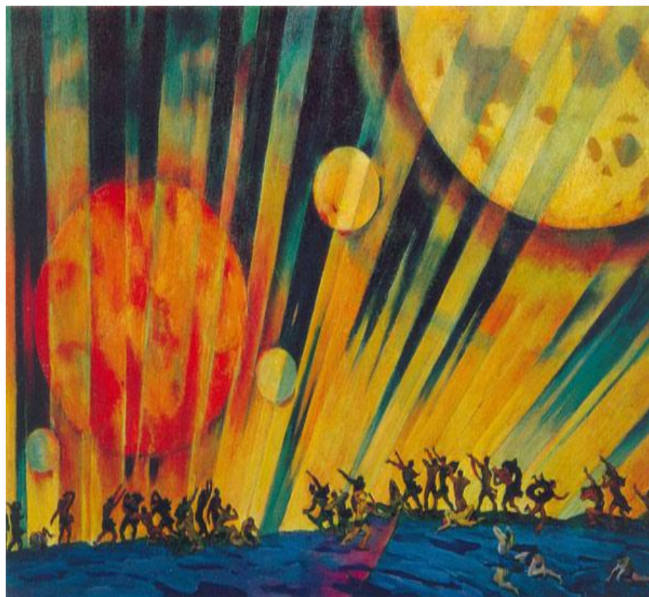
1921 Новая планета.