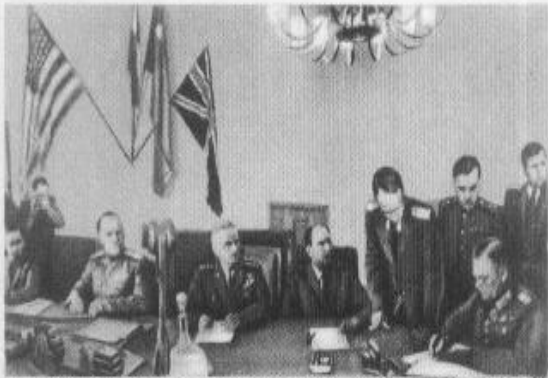
Подписание акта о безоговорочной капитуляции гитлеровской Германии