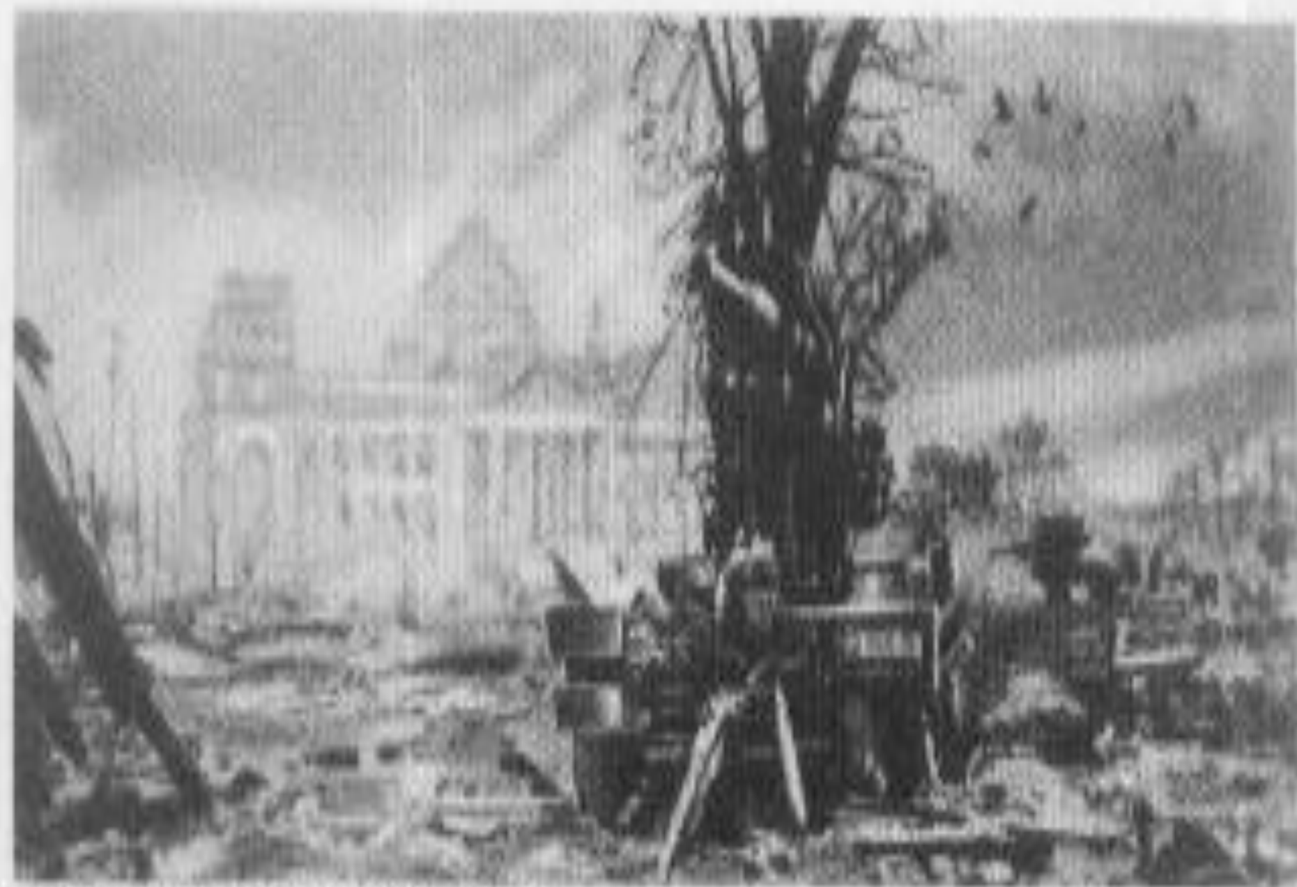
Рейхстаг взят, Берлин, май 1945 г.