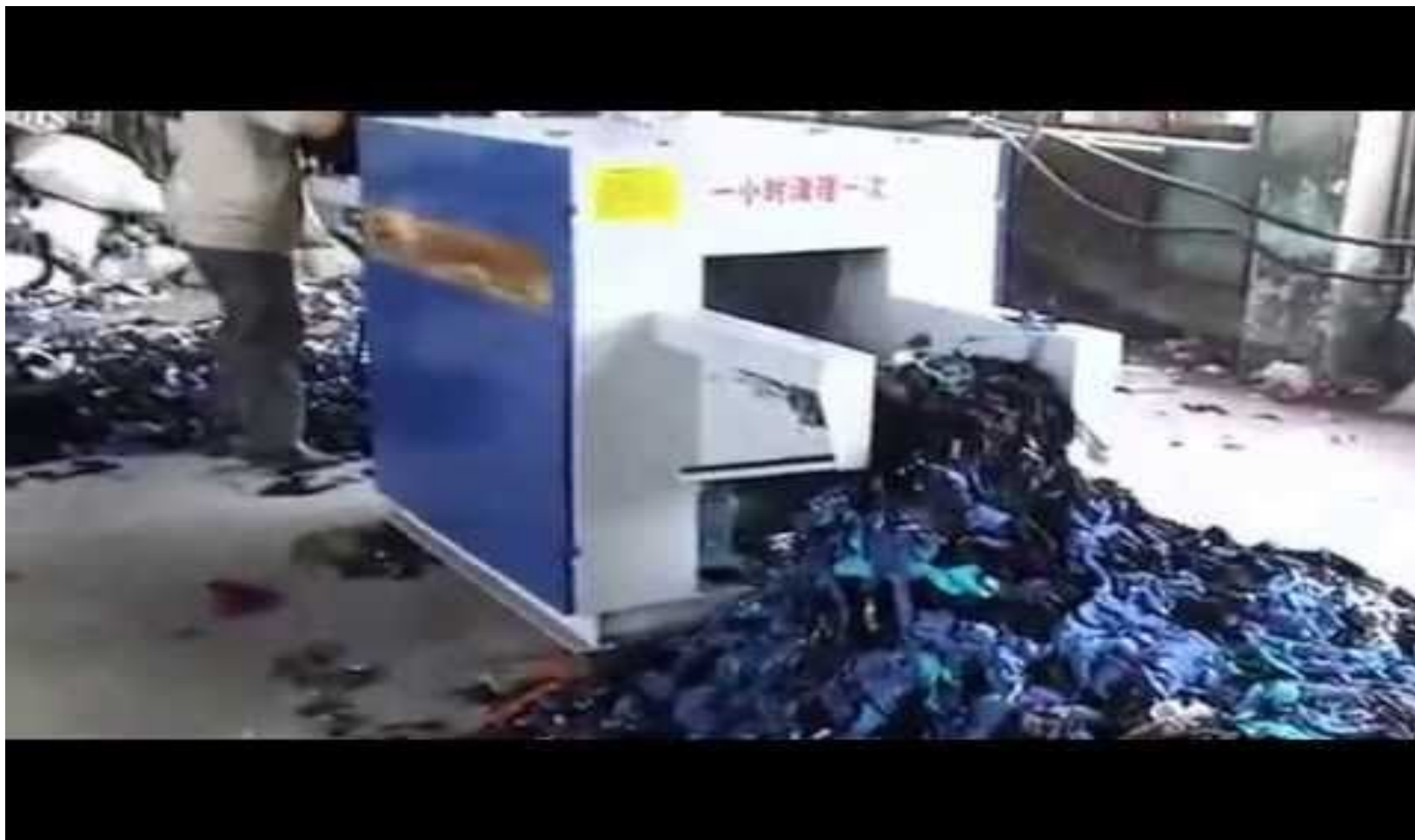
MQ-500 Қайта өңдеу машинасы