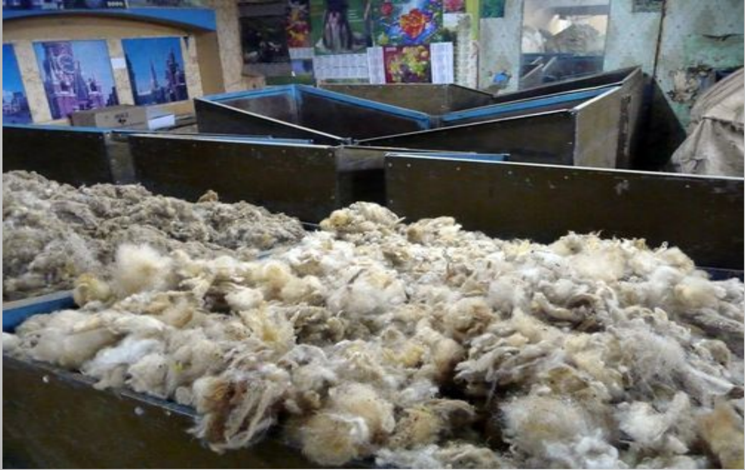
Жүн өндірісінің қалдықтары