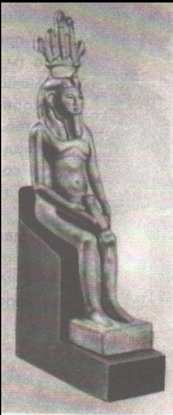
Бог Хапи. VII в. до н. э.