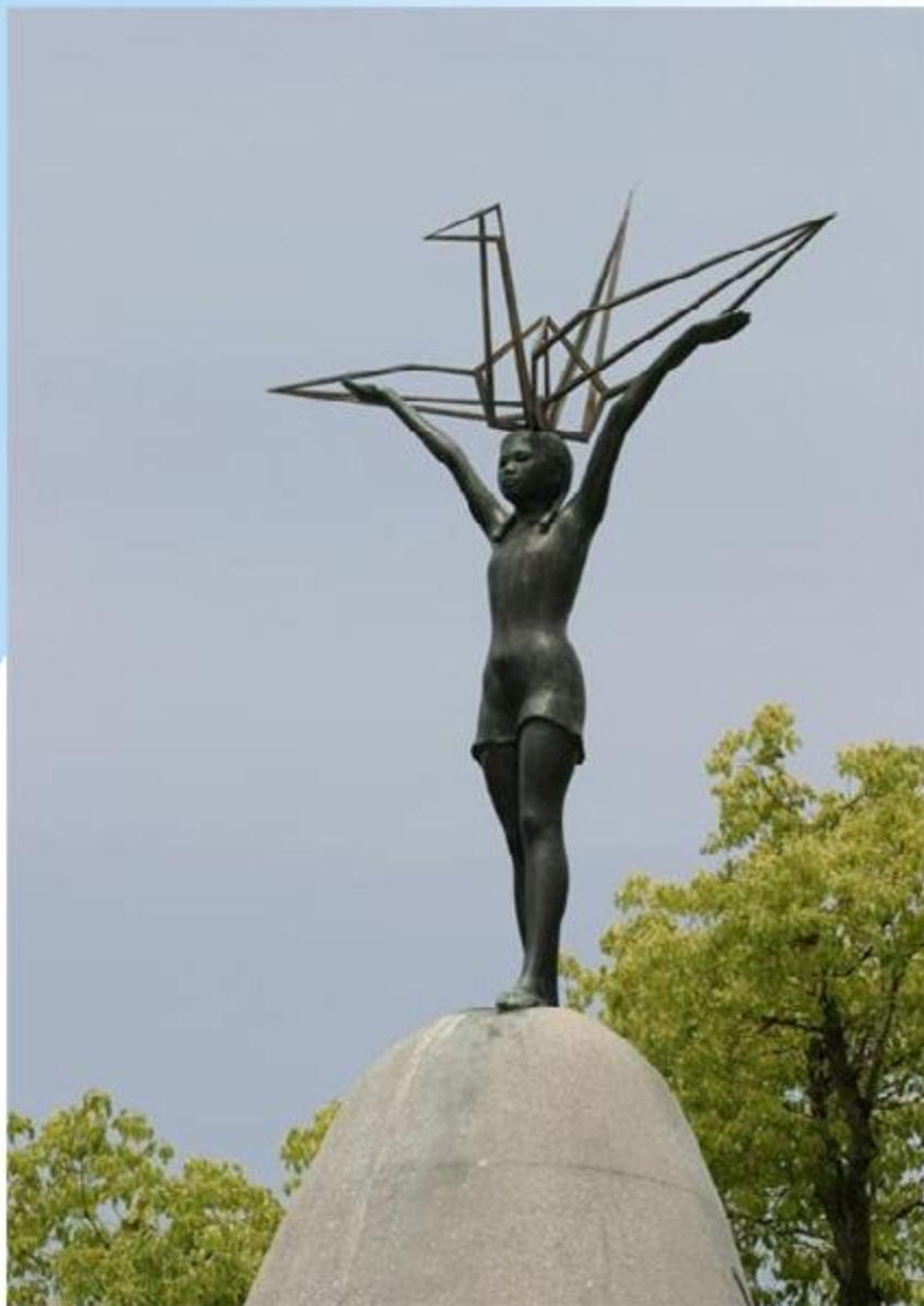
Садако Сасаки стала символом неприятя ядерной войны.

25 октября 1955 года она умерла, не успев сделать тысячи бумажных журавликов. В 1958 году в Парке Мира в городе Хиросима была установлена статуя, изображающая Садако с бумажным журавликом в руке. На постаменте статуи написано: «Это наш крик, Это наша молитва, Мир во всем мире»