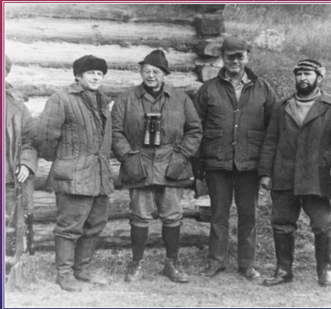
сотрудники ГЛОХ «Байкал», пос. Маритуй, 1981 год

Прибайкальский нацпарк был создан без предварительного проектирования на базе ГЛОХ «Байкал» в Иркутском и Слюдянском районах, также в его территорию вошла большая часть острова Ольхон, и земли на восточном склоне Приморского хребта в Ольхонском районе, закрепленные до этого за совхозами, колхозом «Имени XX партсъезда» и лесхозами – Ольхонским и Голоустенским.