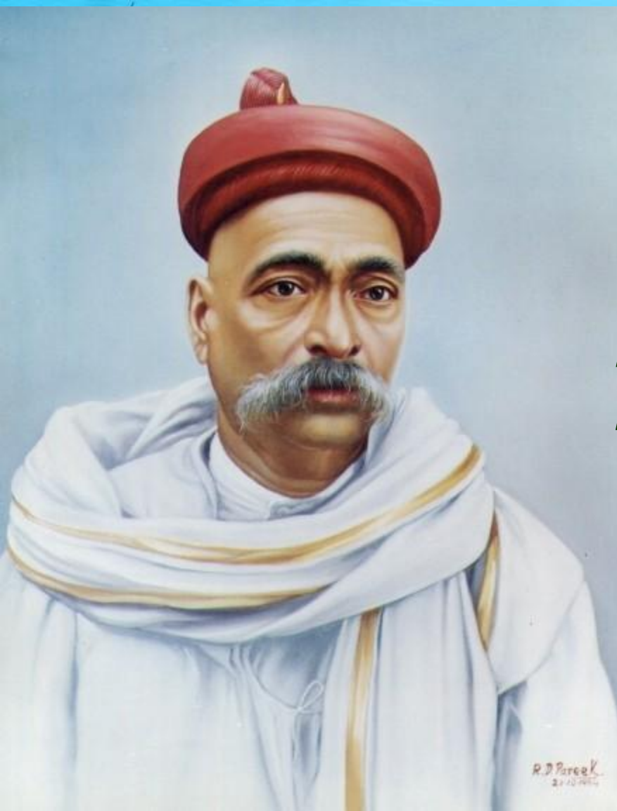
Балгангадхар Тилак (1856—1920).

В декабре 1885 г. в Бомбее была создана первая индийская политическая партия — Индийский национальный конгресс (ИНК).