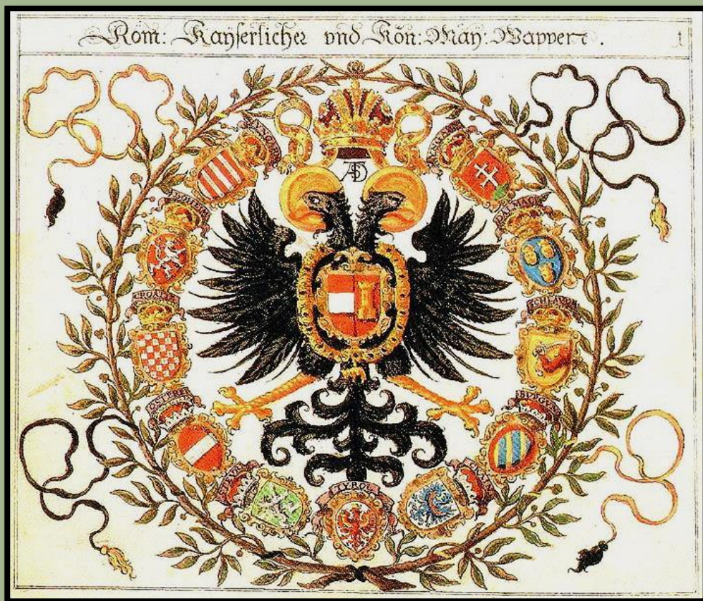
Герб императора Священной Римской империи из династии Габсбургов

В первой половине XV века императорский престол перешел к династии Габсбургов , которые владели Австрией и соседними с ней славянскими землями.