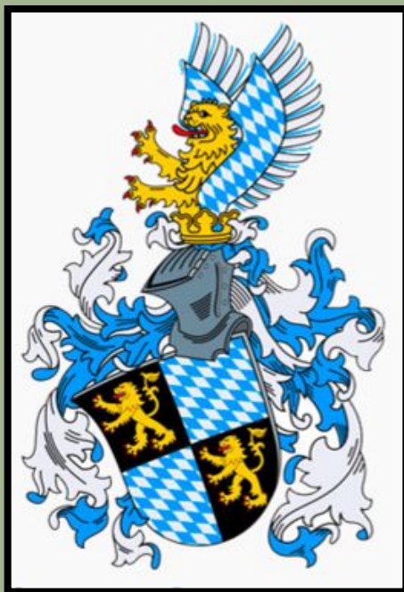
Герб династии Виттельсбахов, правивших в Баварии

В своих владениях немецкие герцоги и князья чеканили монету, собирали налоги и пошлины, судили людей, основывали города. Императоры Священной Римской империи вынуждены были считаться с властью немецких князей.