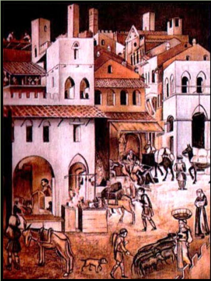
Улица в средневековой Сиене (Италия). XIV век

Богатые города Северной и Средней Италии – Милан, Флоренция, Пиза, Болонья, Генуя и другие – были городами - государствами или городскими республиками со своими органами управления.