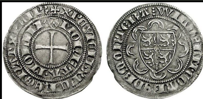
Широкий пфенниг. Герцогство Юлих-Берг. Германия, XIV век