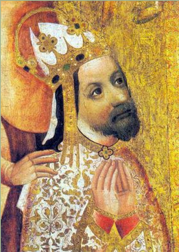
Карл IV (1347-1378)

Императоры Священной Римской империи, не имея сильной власти, пытались удержать влияние за счет расширения своих родовых владений.