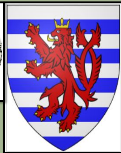
Герб династии Люксембургов