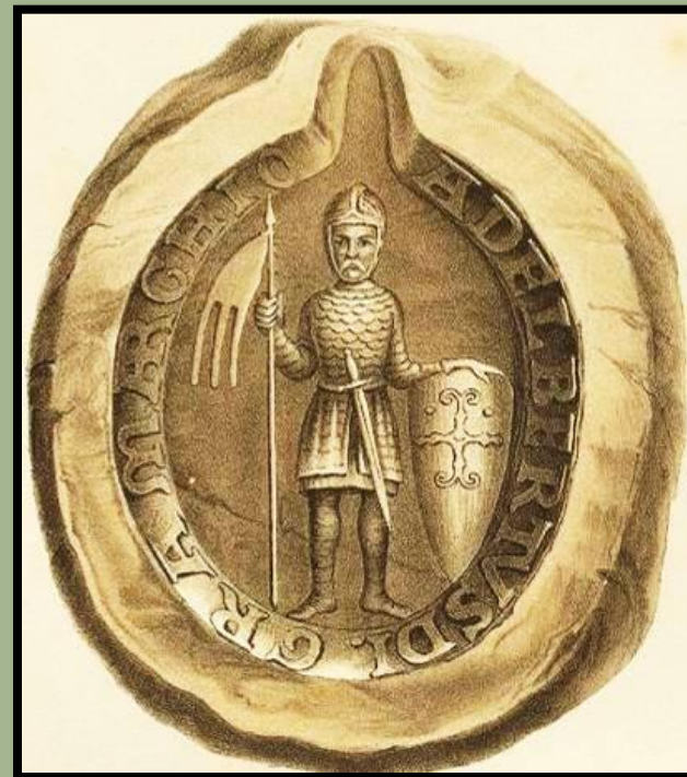
Печать Альбрехта Медведя

На месте славянского города Бранибор Альбрехт Медведь основал княжество Бранденбург. Позднее на его территории возник г. Берлин.