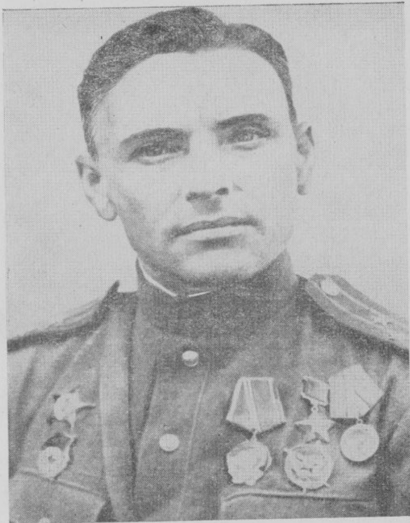
Герой Советского Союза гвардии полковник Григорий Скируто