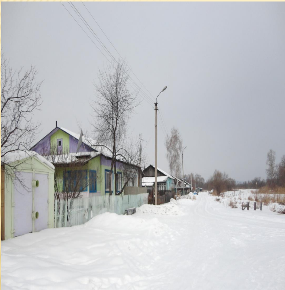
ФОТО УЛИЦЫ ДИКОПОЛЬЦЕВА В ЛЕРМОНТОВКЕ