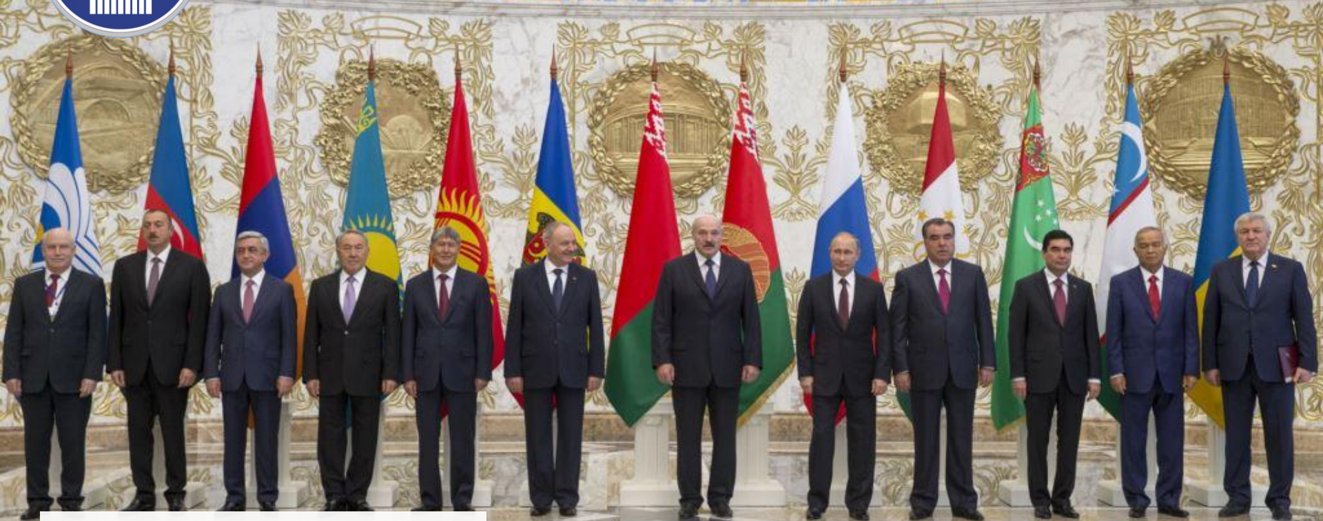
Содружество независимых государств