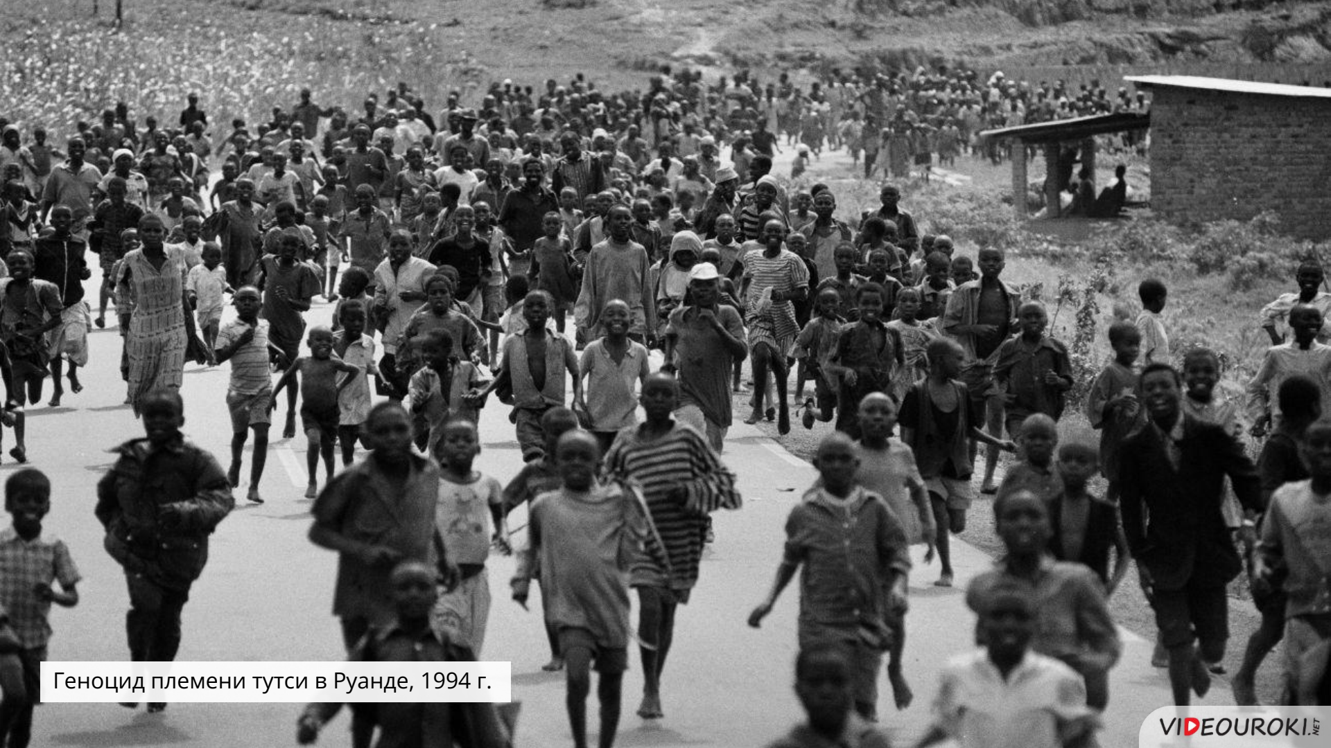
Геноцид племени тутси в Руанде, 1994 г.