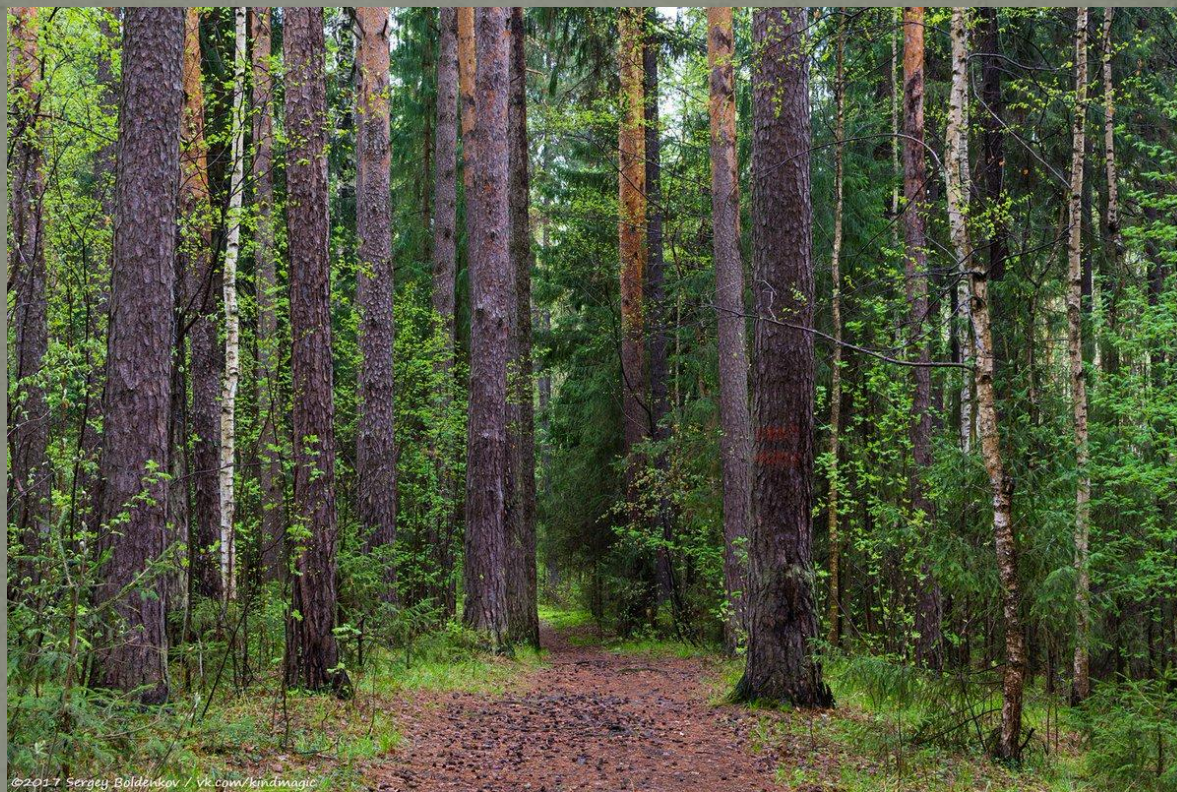
Черняевский лес, г. Пермь