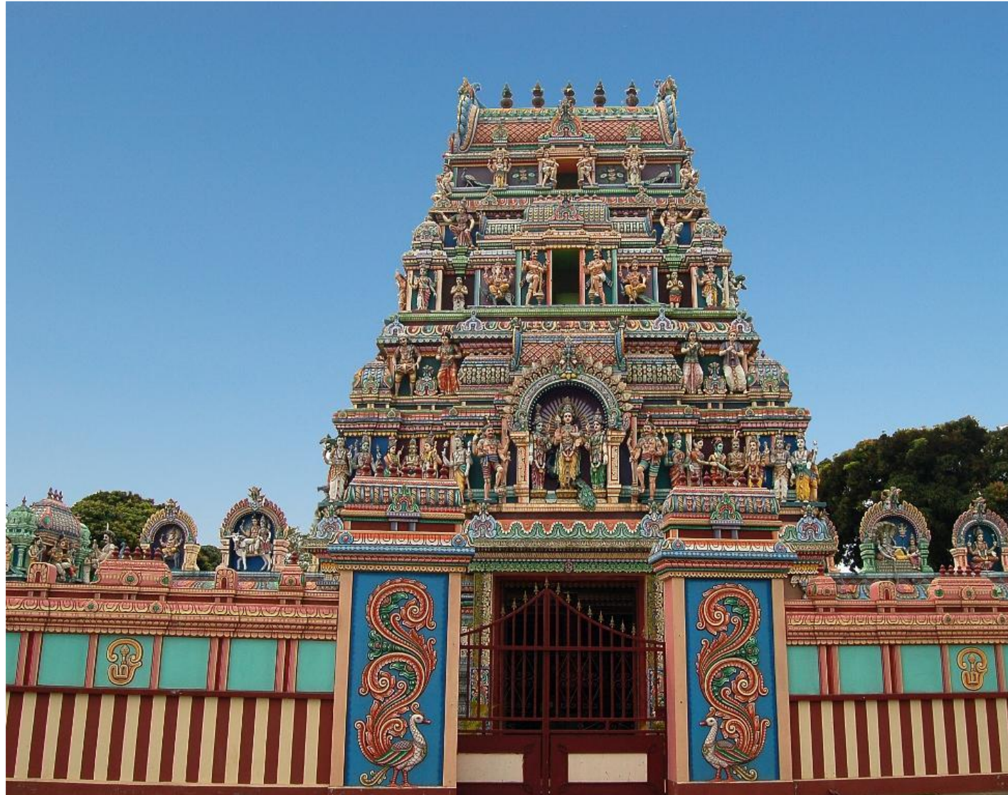
Храм в Реюньоне