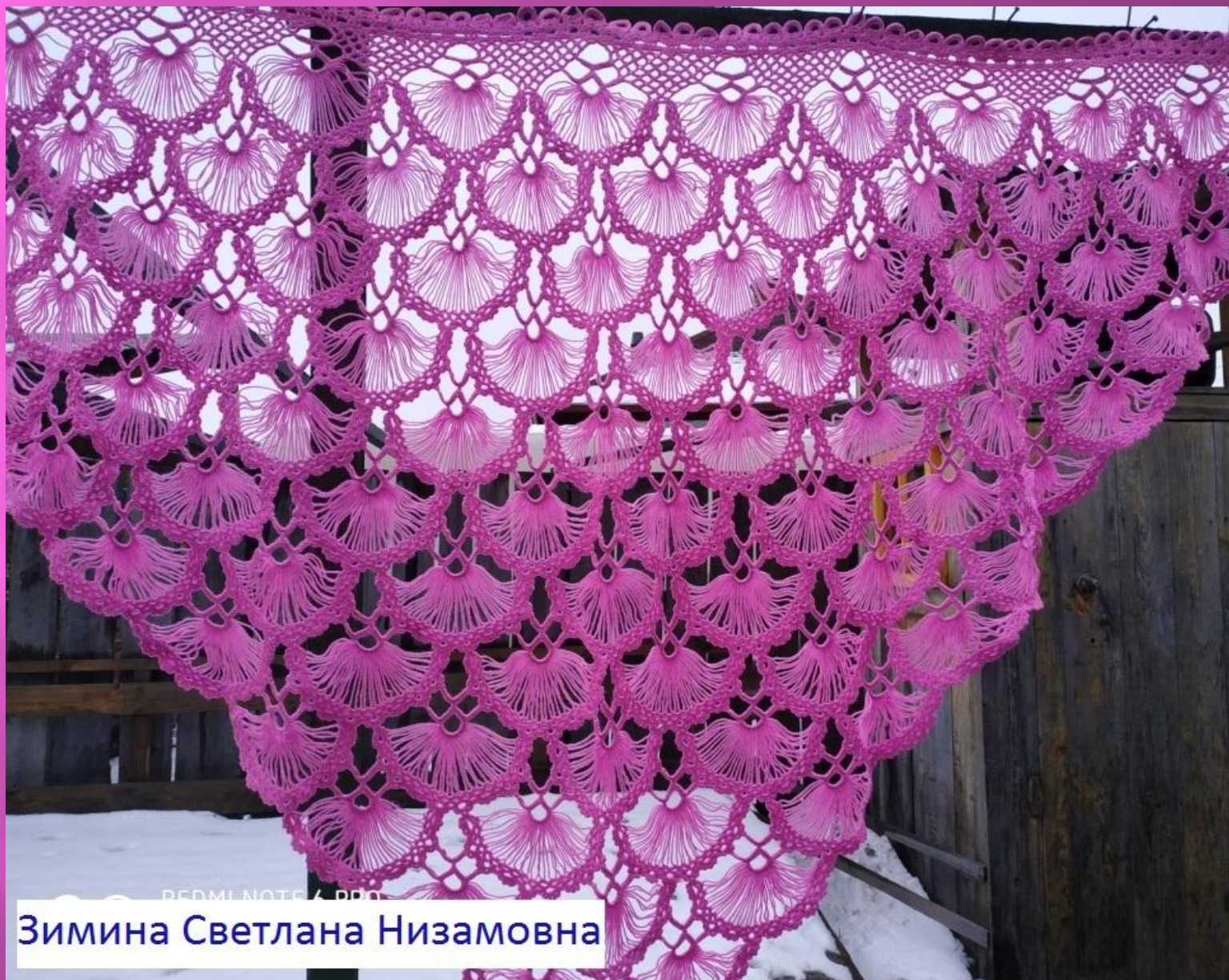
Зими́на Светла́на Низамо́вна