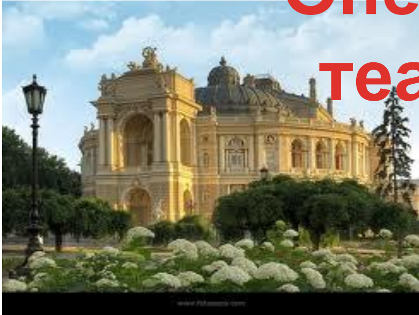
Одесский театр оперы и балета