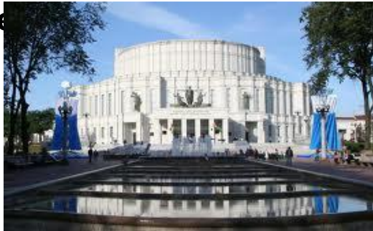
Минский театр оперы и балета