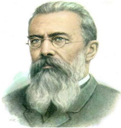
Н.А. Римский Корсаков Островски