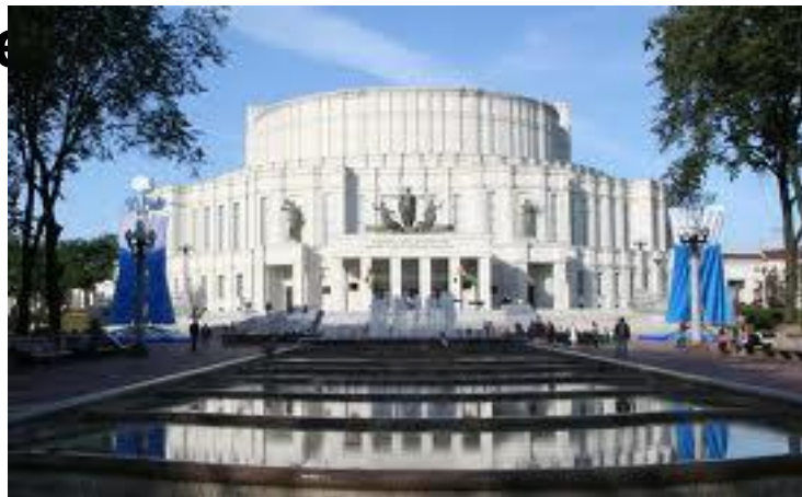
Минский театр оперы и балета