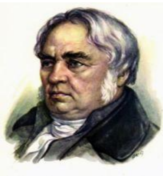
Иван Андреевич Крылов