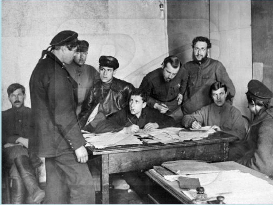
Воззвание Кронштадтского гарнизона