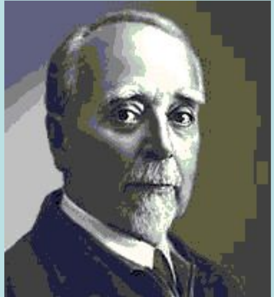
Г. Кржижановский председатель ГОСПлана

План был рассчитан на 10-15 лет и состоял из двух основных программ. Программа А предусматривала восстановление и реконструкцию довоенной электроэнергетики. Программа Б — строительство 30 электростанций (20 тепловых и 10 ГЭС) в основных регионах страны с учетом их природных ресурсов и потребностей развития промышленности