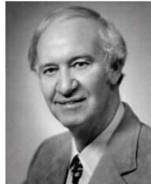
Malcolm Shepherd Knowles (1913 - 1997)