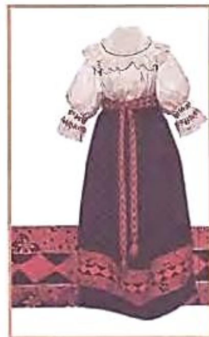
Русские народные свадебные костюмы