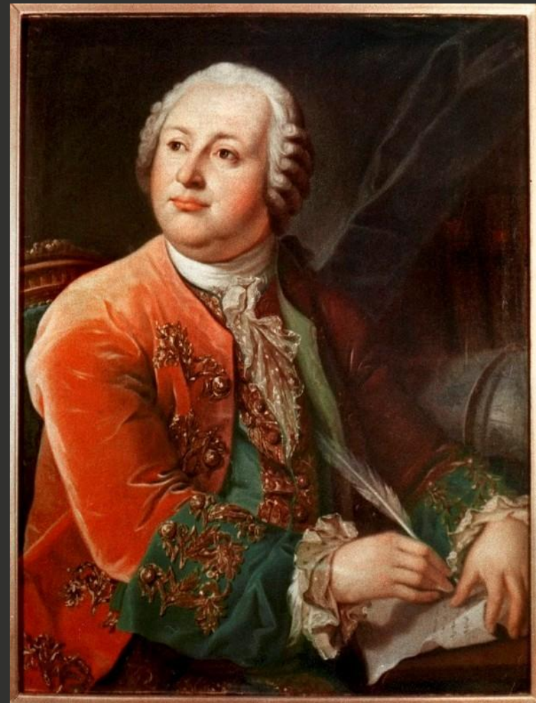
(М. В. Ломоносов)