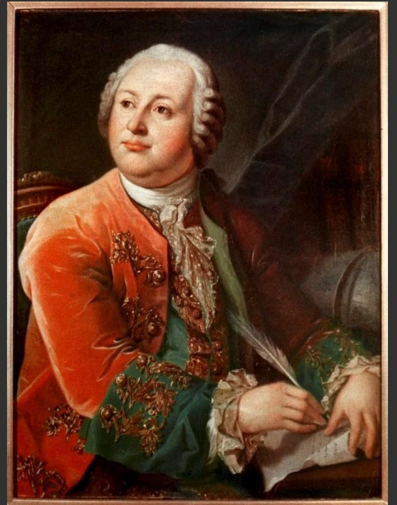
(М. В. Ломоносов)