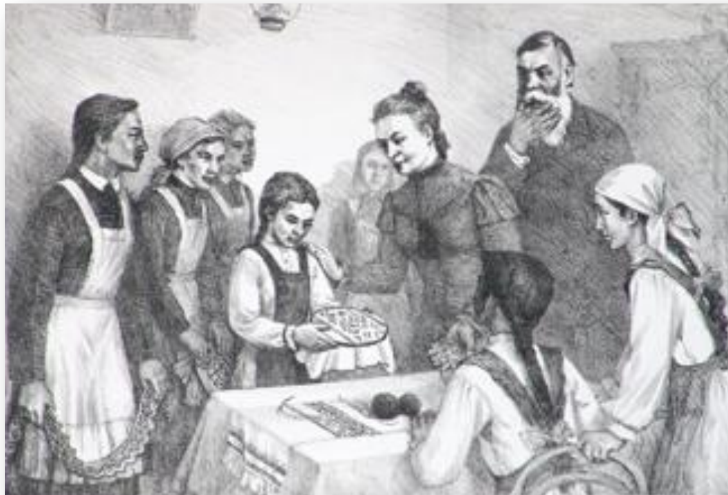
Сизов П. В. Чувашская вышивка. 1985 г.