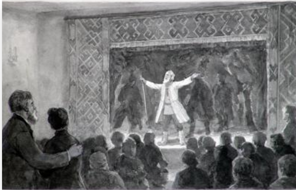
Сизов П. В. «Иван Сусанин» на сцене Симбирской чувашской школы. 1986 г.