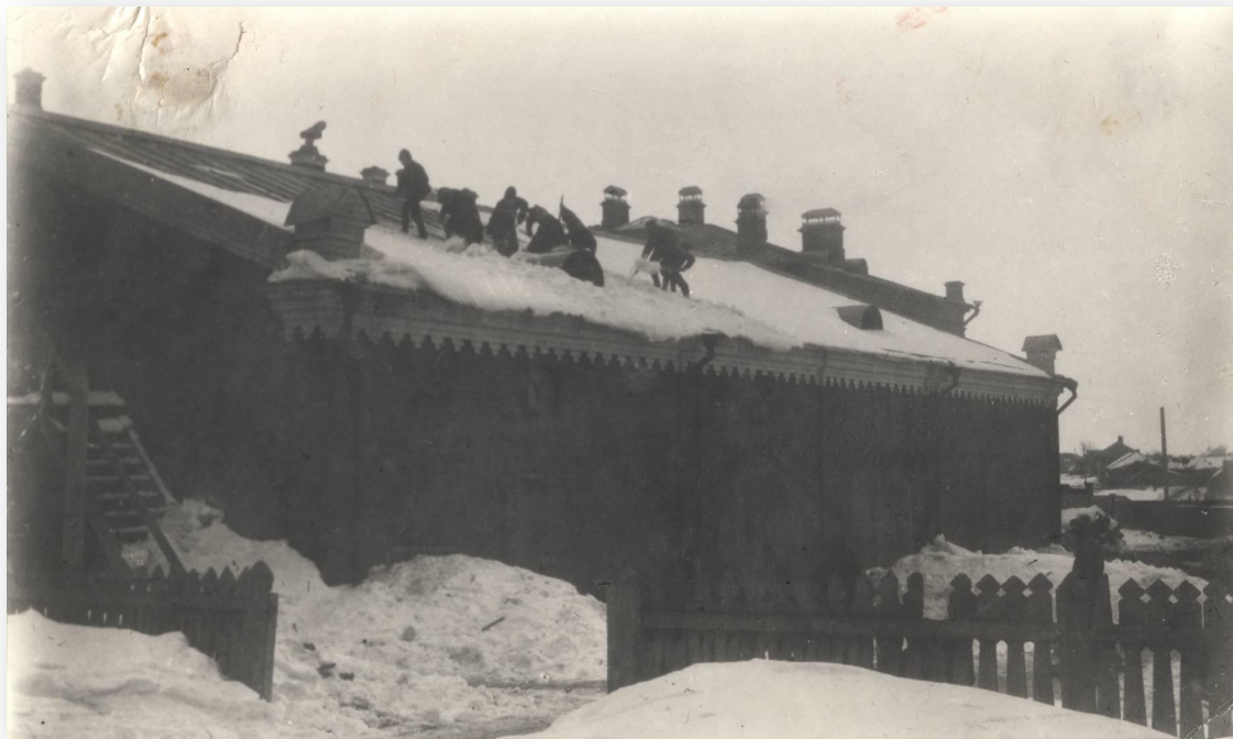
Учащиеся чувашской школы на уборке снега