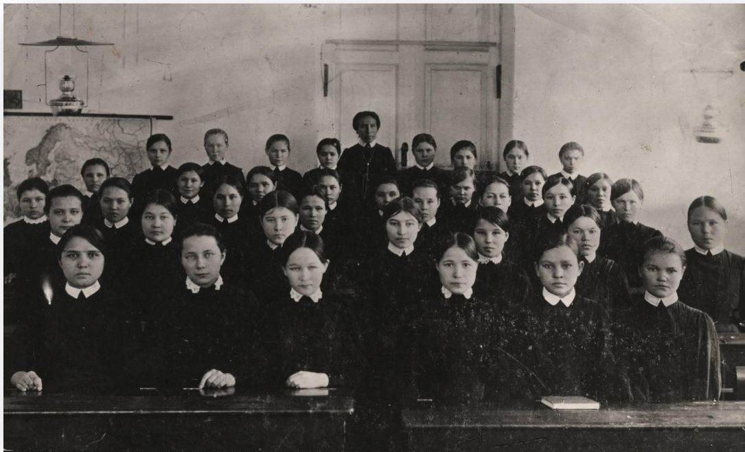
Воспитанницы Симбирской чувашской учительской школы. Выпуск 1915 г.