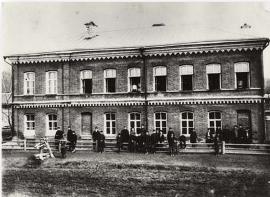
Первое здание Симбирской чувашской школы