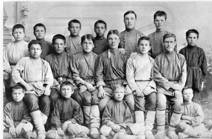
Учащиеся Симбирской чувашской школы 1896 года