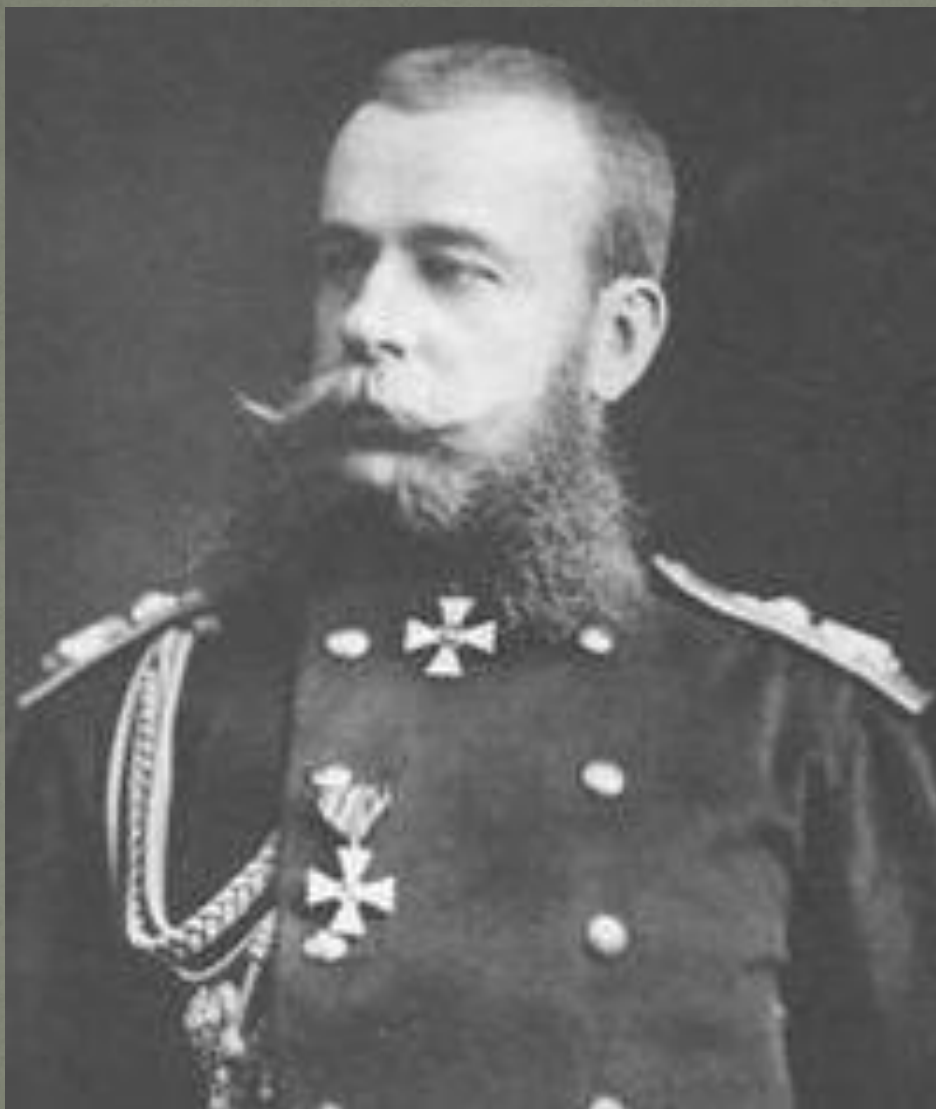
ГЕНЕРАЛ РУССКОЙ АРМИИ Михаил Дмитриевич СКОБЕЛЕВ