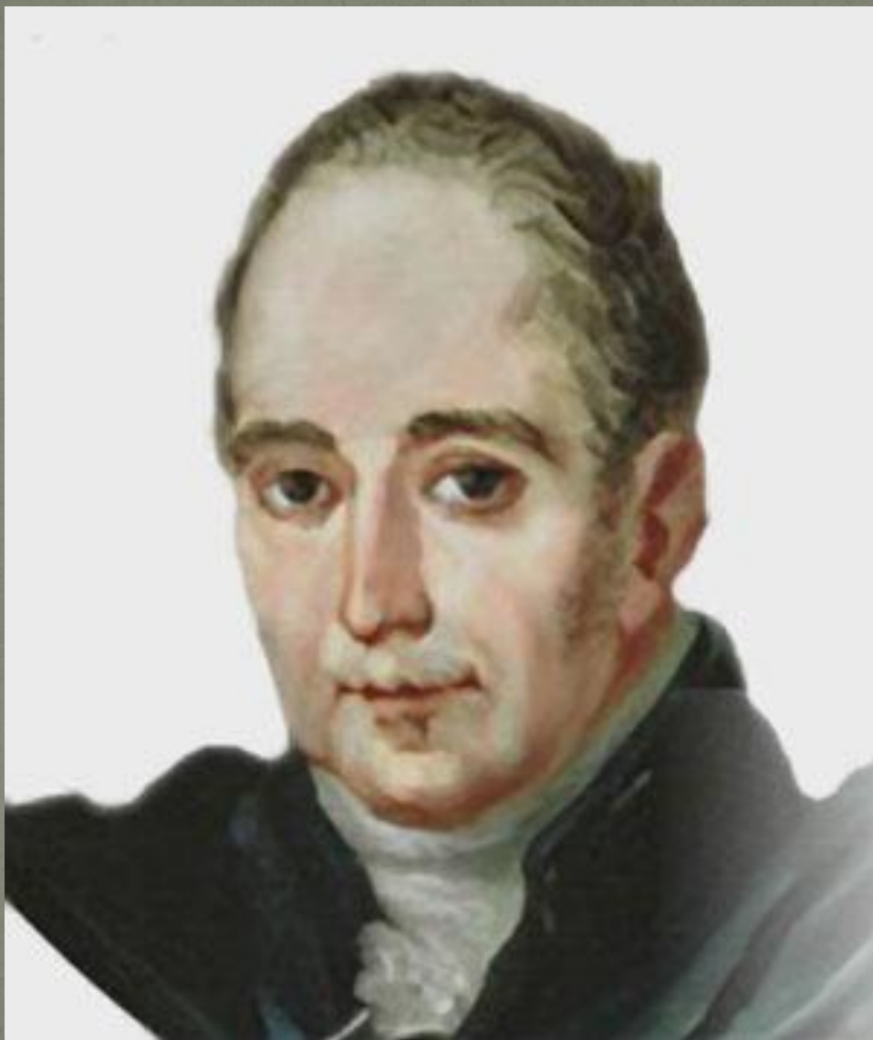
Русский художник Владимир Лукич БОРОВИКОВСКИЙ