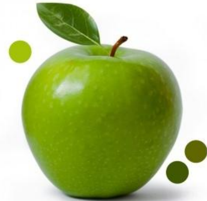
работы художника Cheifetz David