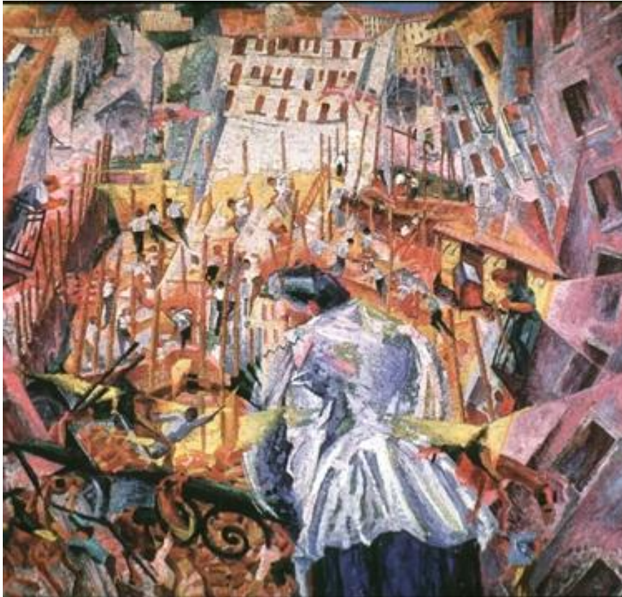
Умберто Боччони — Улица входит в дом. 1911