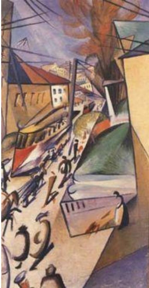
А. Богомазов. Трамвай. 1914

Направление в искусстве 1910-х гг., наиболее характерное для русского художественного авангарда тех лет, стремившегося соединить принципы искусства 1910-х гг., наиболее характерное для русского художественного авангарда тех лет, стремившегося соединить принципы кубизма (разложение предмета на составляющие