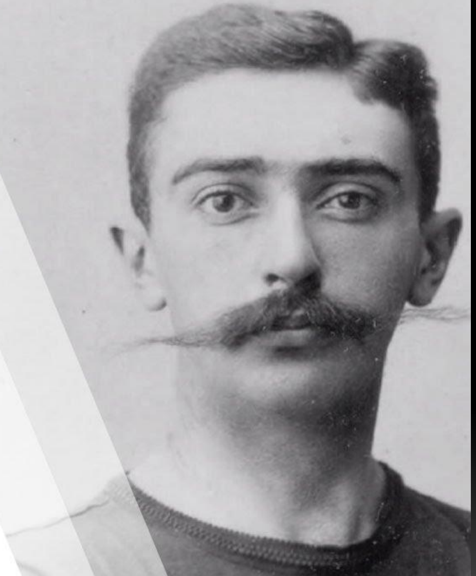
Pierre de Coubertin ( 1863-1937 )