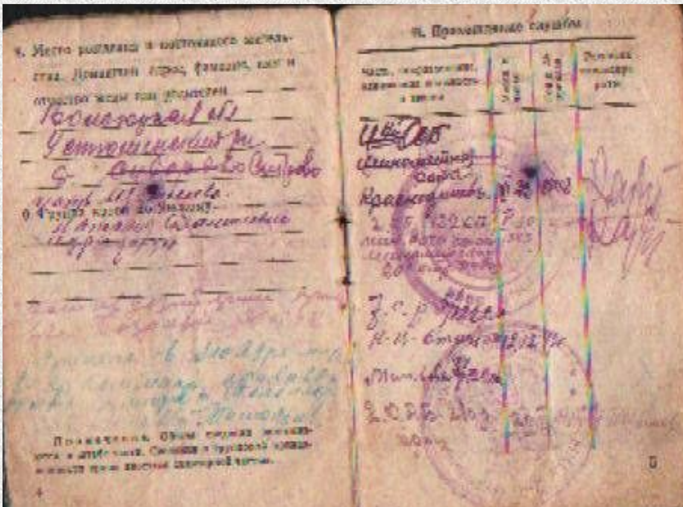
Красноармейская книжка, страница 2