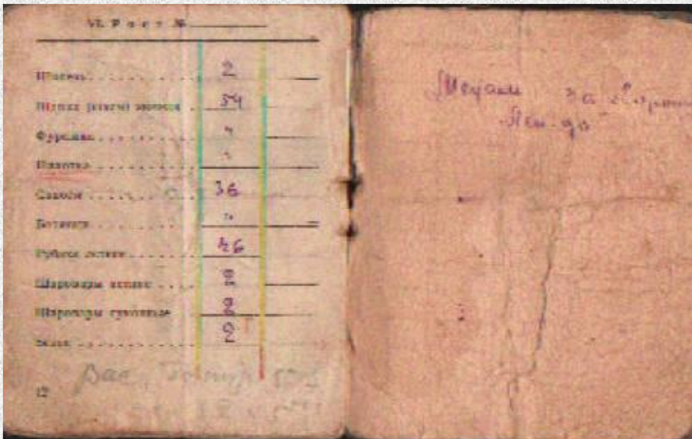
Красноармейская книжка, страница 4