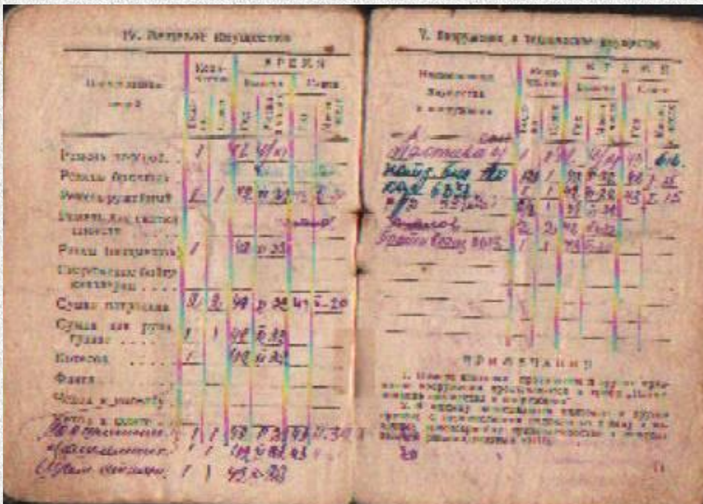
Красноармейская книжка, страница 5