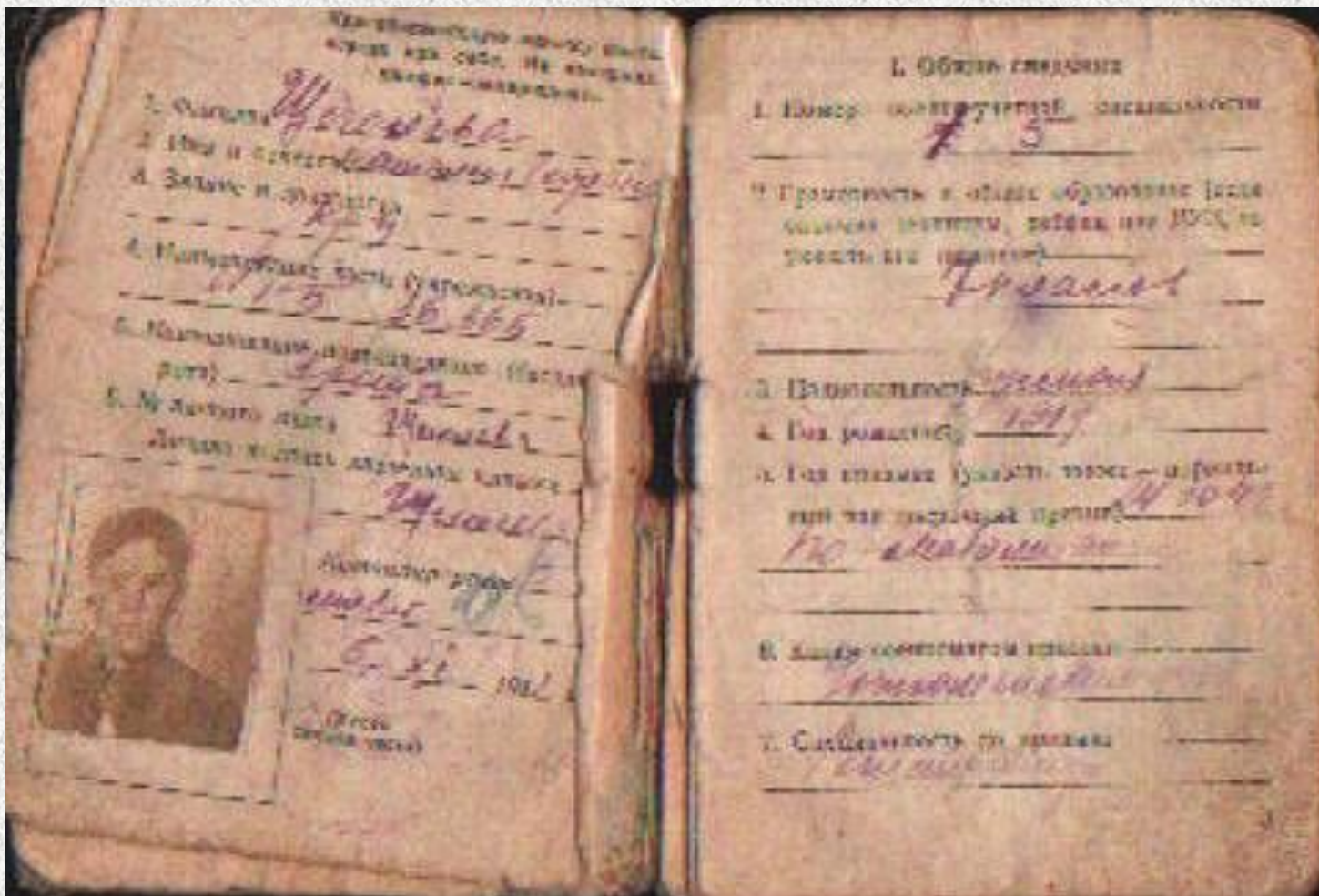
Красноармейская книжка, страница 1