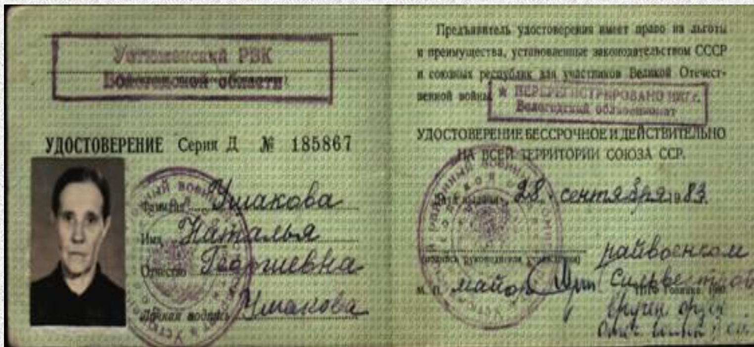
Удостоверение участника Великой Отечественной войны 1983 г.