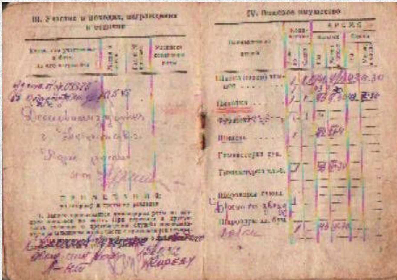
Красноармейская книжка, страница 3