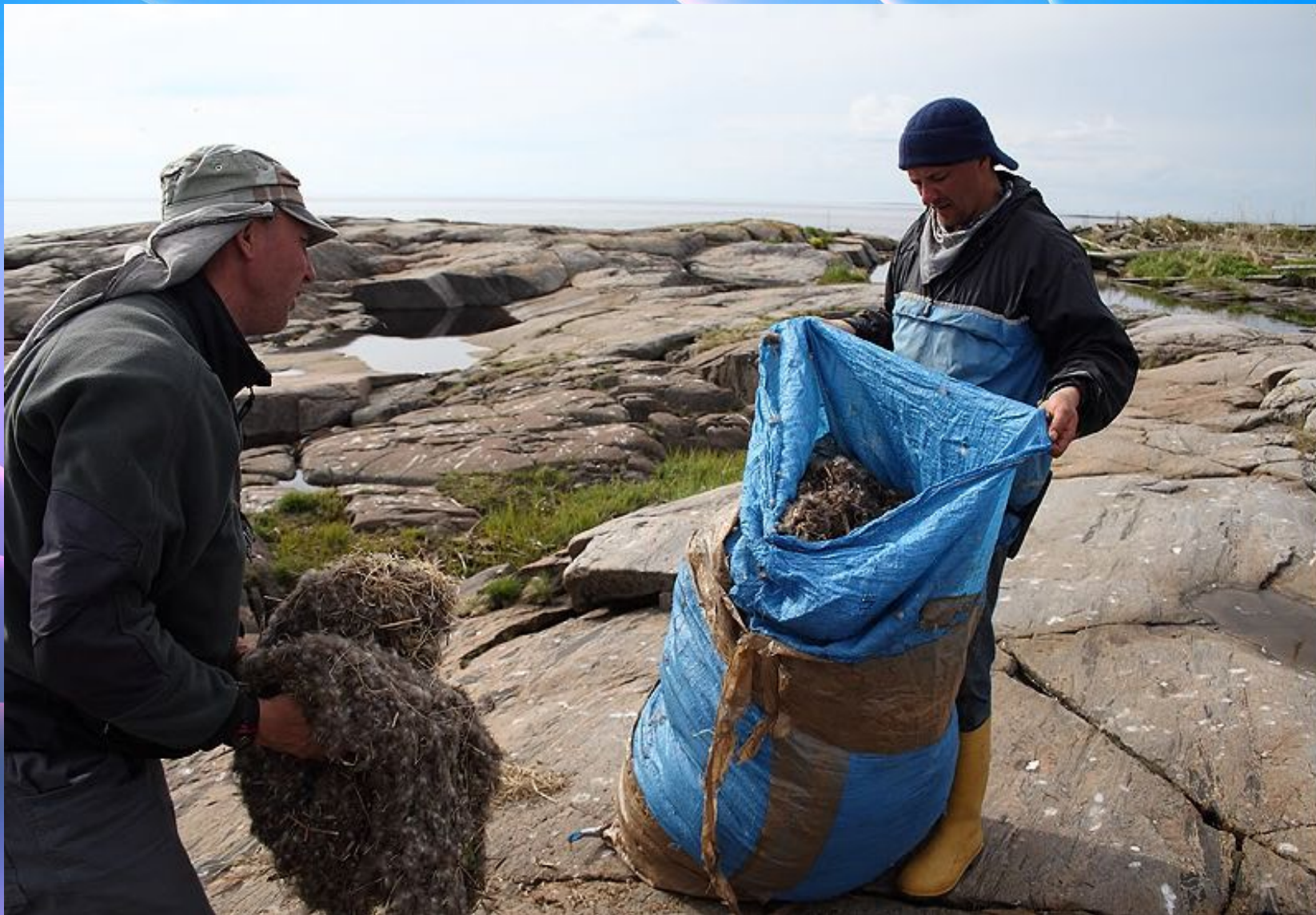
Сбор гагачьего пуха