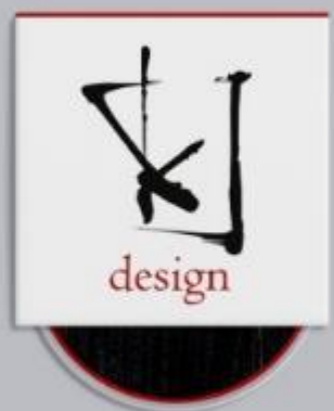
Фирменный стиль для графического дизайнера Выпускная работа Одноварченко Ксении