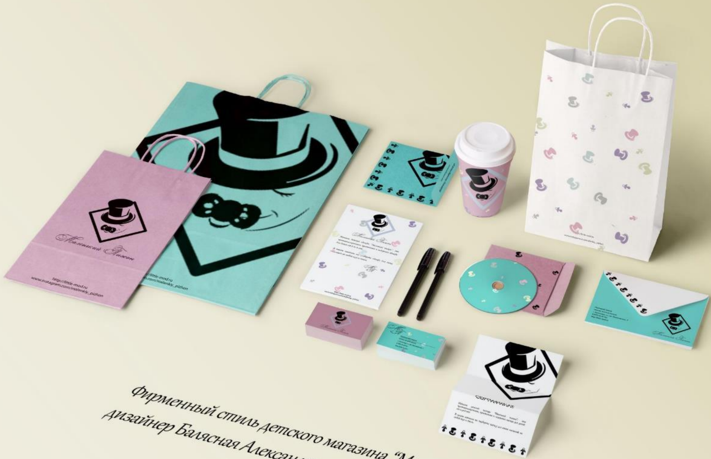
Фирменный стиль детского магазина "Маленький тижон" Дизайнер Балясная Александра