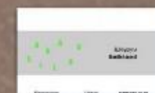
ГРАФИЧЕСКИЙ ДИЗАЙНЕР ДЫНИНА КСЕНИЯ