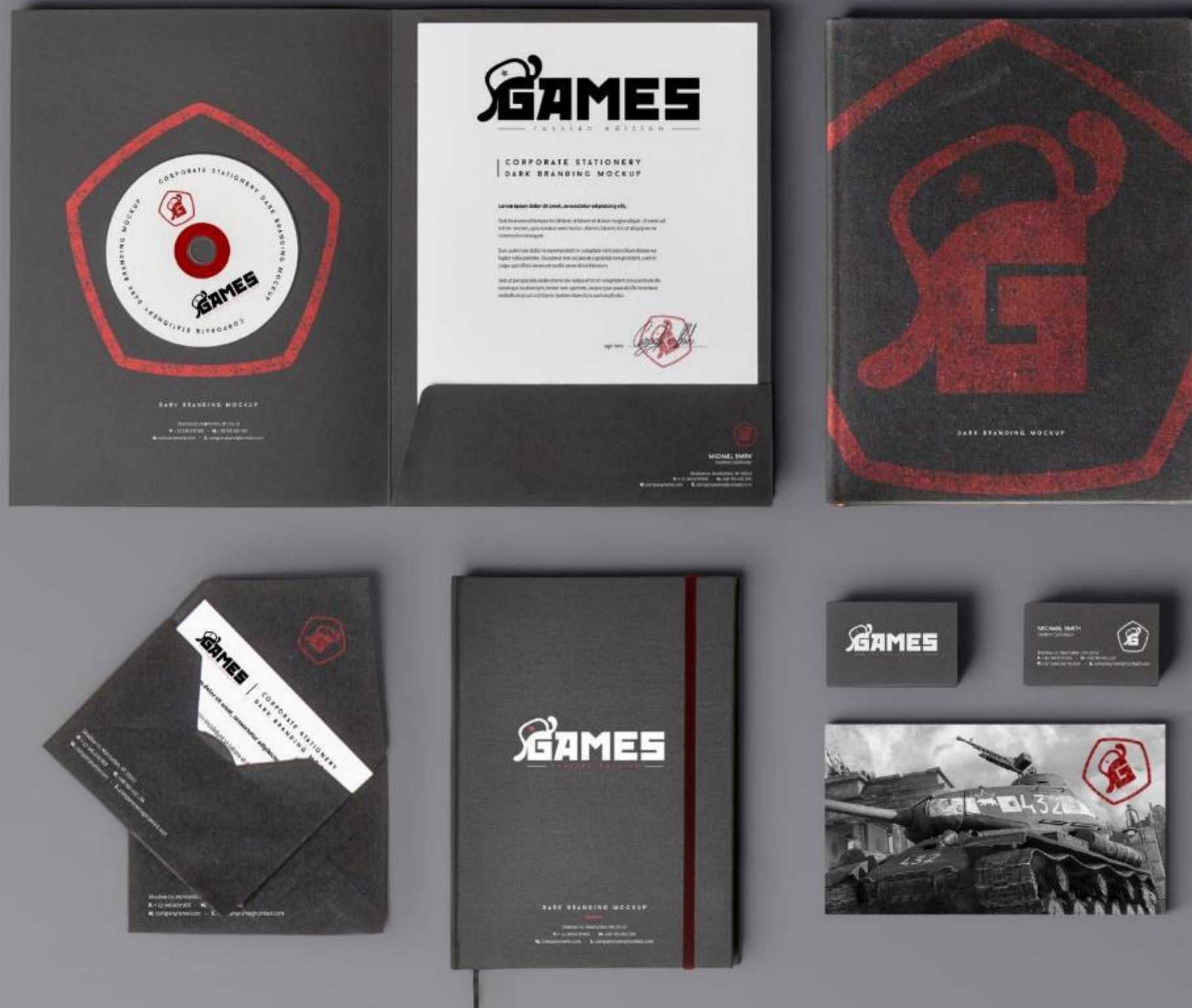
Фирменный стиль студии по разработке игр "Russian Edition Games" Дизайнер: Владимиров А.В.