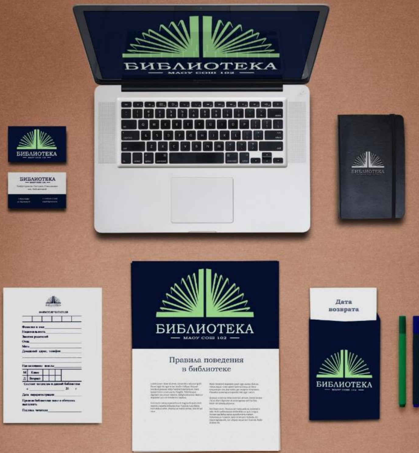
Фирменный стиль школьной библиотеки, дизайнер Воробьева Дарья