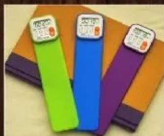
Intelligent Library Bookmark («умная библиотечная закладка»)...