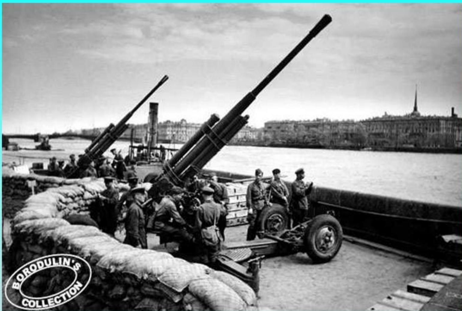
На берегу Невы.