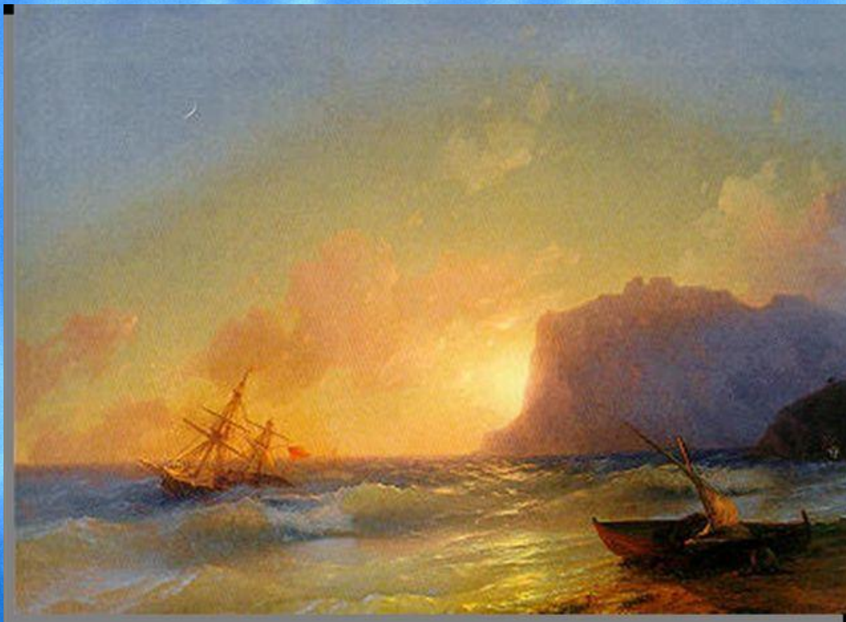
И.К.Айвазовский "Море. Коктебель" 1853г.