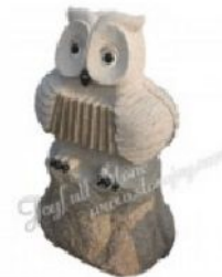
KE-363, Granite owls