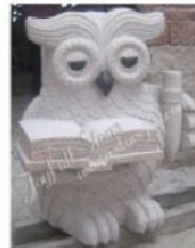
KE-313, Granite Owls