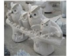
KE-409, owls on the tree