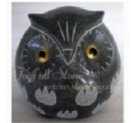
KR-117-2, Granite owl crafts