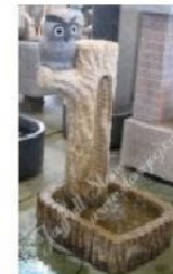
GFO-087, Water fountain with owl sculpture