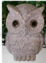
KE-413, Grey granite owl