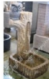
GFO-087, Water fountain with owl sculpture