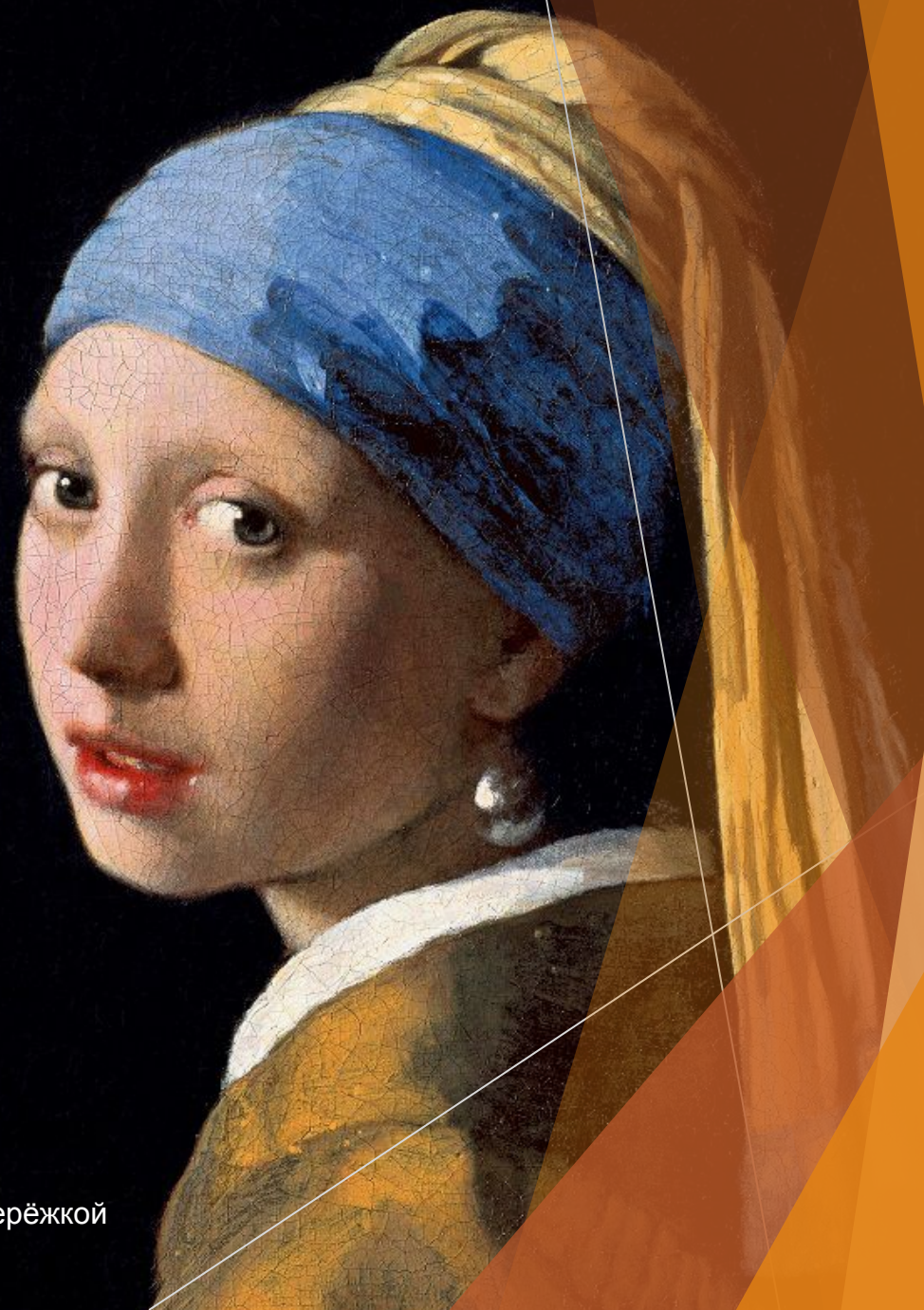
Девушка с жемчужной серёжкой Картина – Ян Вермеер