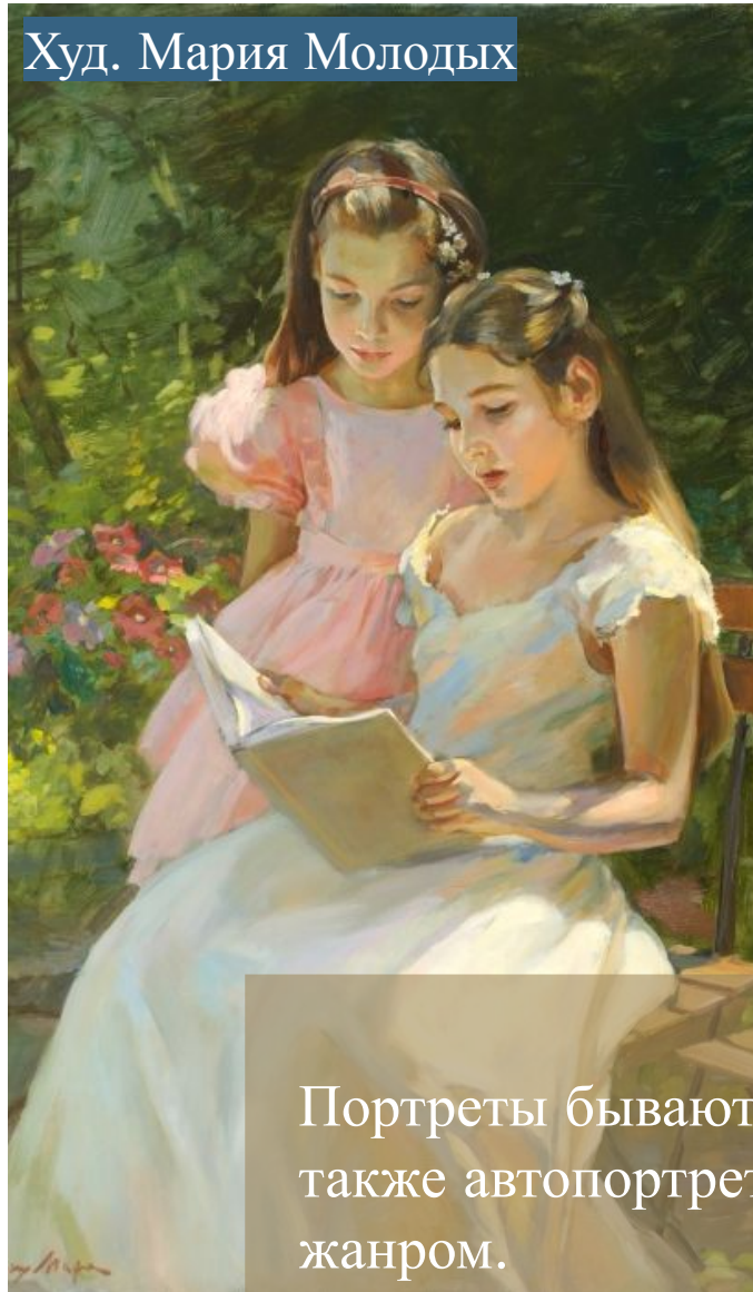
Худ. Мария Молодых

Портреты бывают одиночные, парные, групповые, а также автопортрет, который иногда выделяют отдельным жанром.