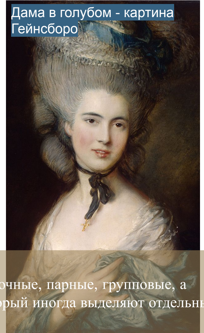
Дама в голубом - картина Гейнсборо

Портреты бывают одиночные, парные, групповые, а также автопортрет, который иногда выделяют отдельным жанром.