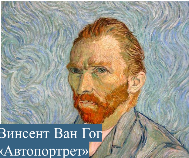
Винсент Ван Гог «Автопортрет»