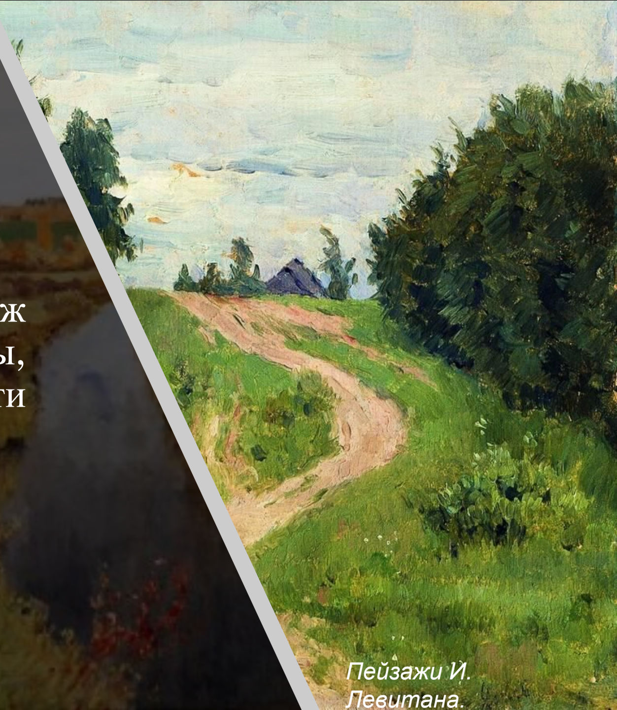
Пейзажи И. Левитана.