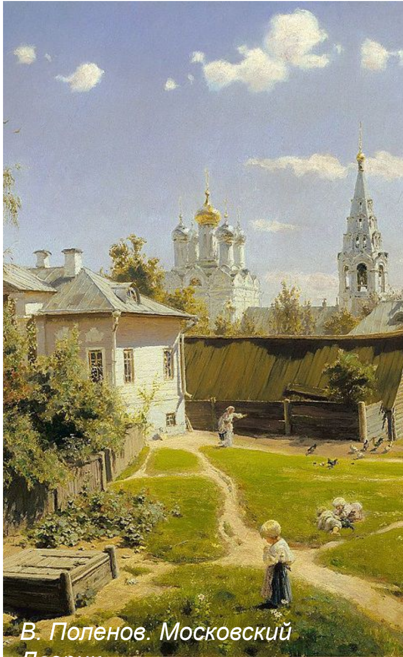
В. Поленов. Московский Дворик