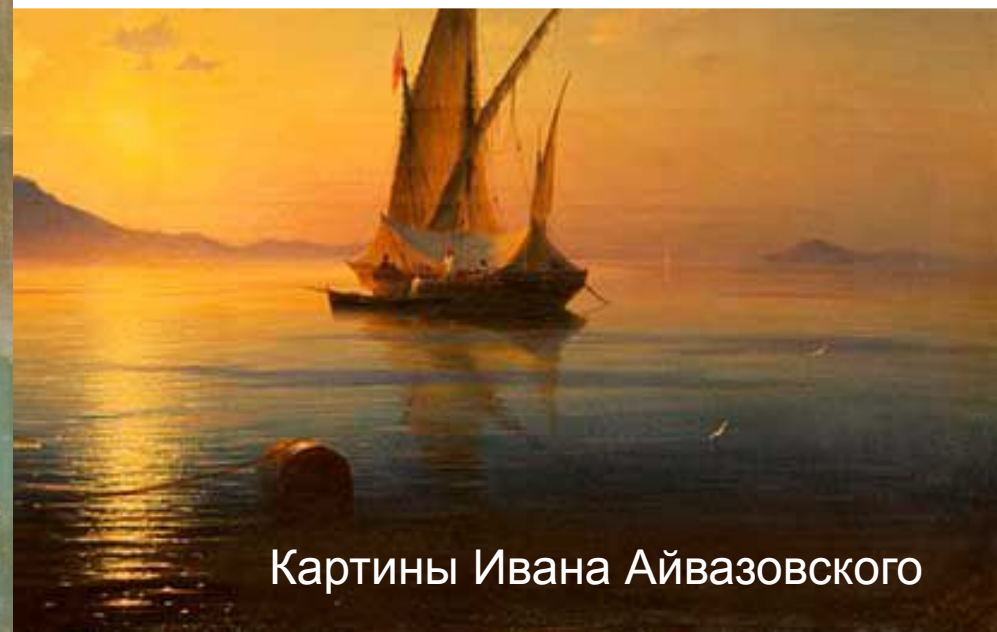
Картины Ивана Айвазовского