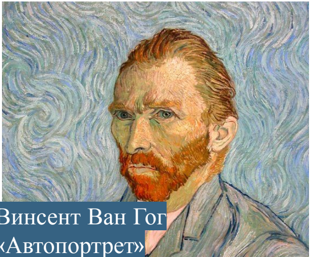
Винсент Ван Гог «Автопортрет»