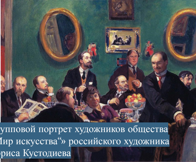
Групповой портрет художников общества „Мир искусства“ российского художника Бориса Кустодиева