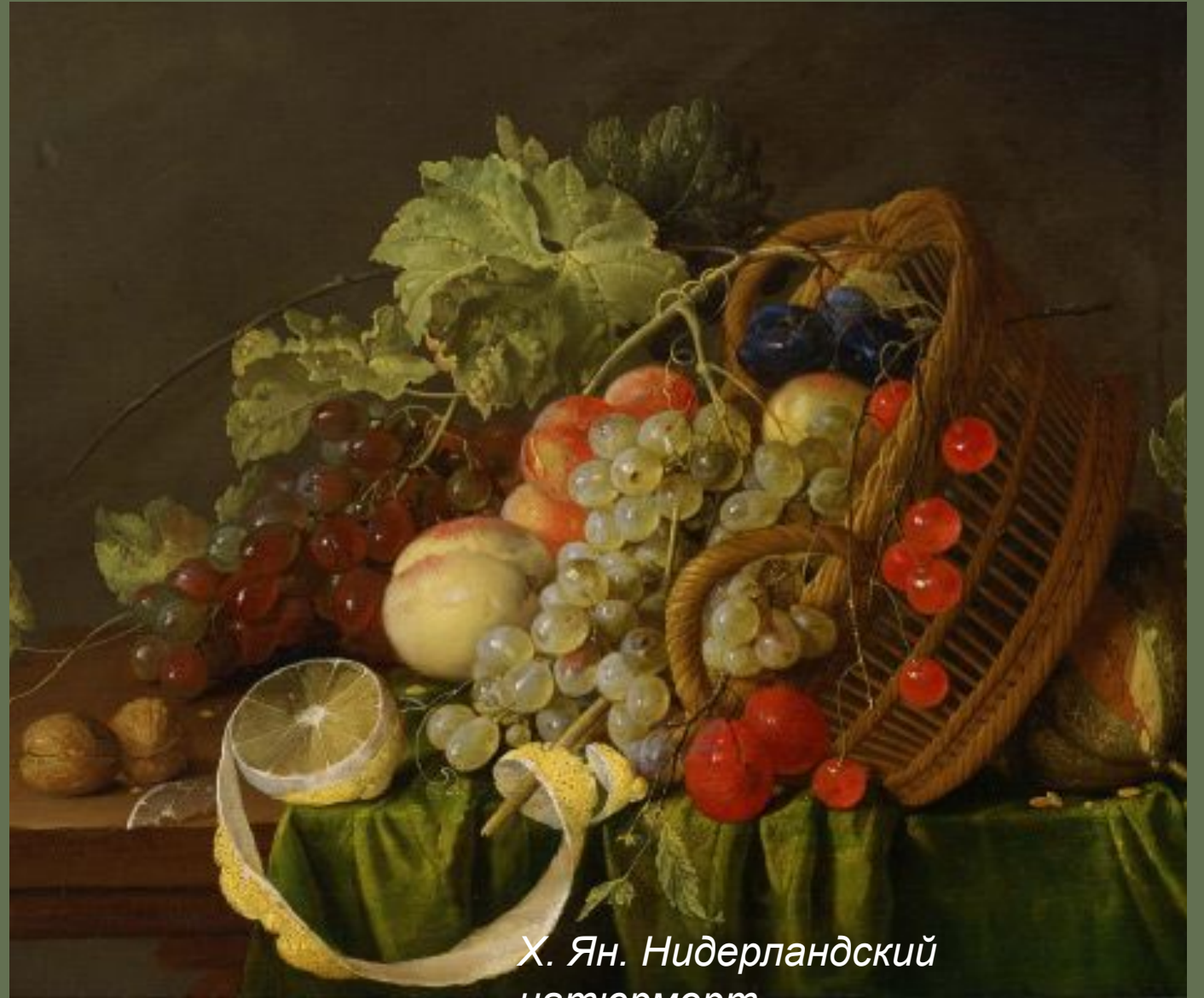
Х. Ян. Нидерландский натюрморт.