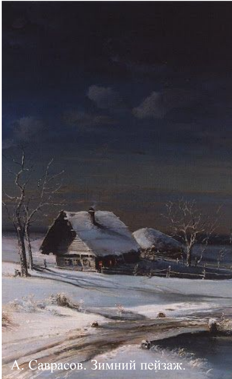
А. Саврасов. Зимний пейзаж.