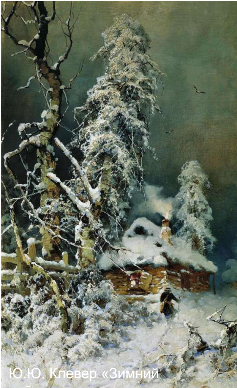
Ю.Ю. Клевер «Зимний»