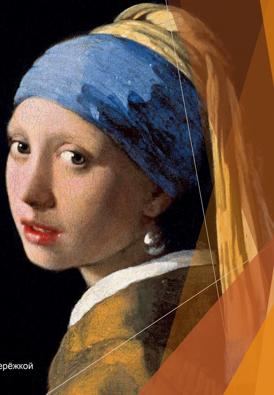
Девушка с жемчужной серёжкой Картина – Ян Вермеер