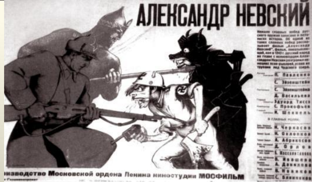
34. Александр Невский. Плакат 1941 г.