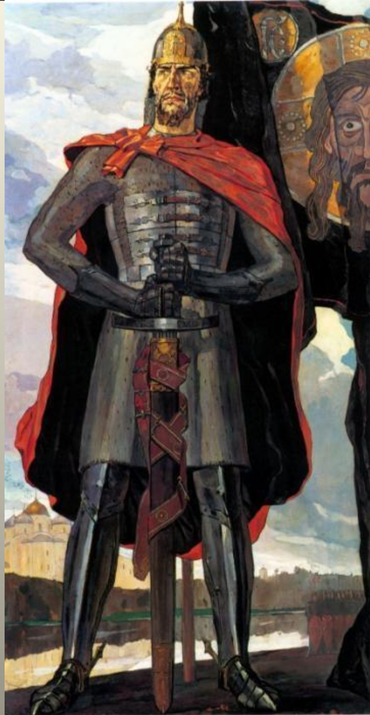
4 И. Копин. Александр Невский. 1942 г.