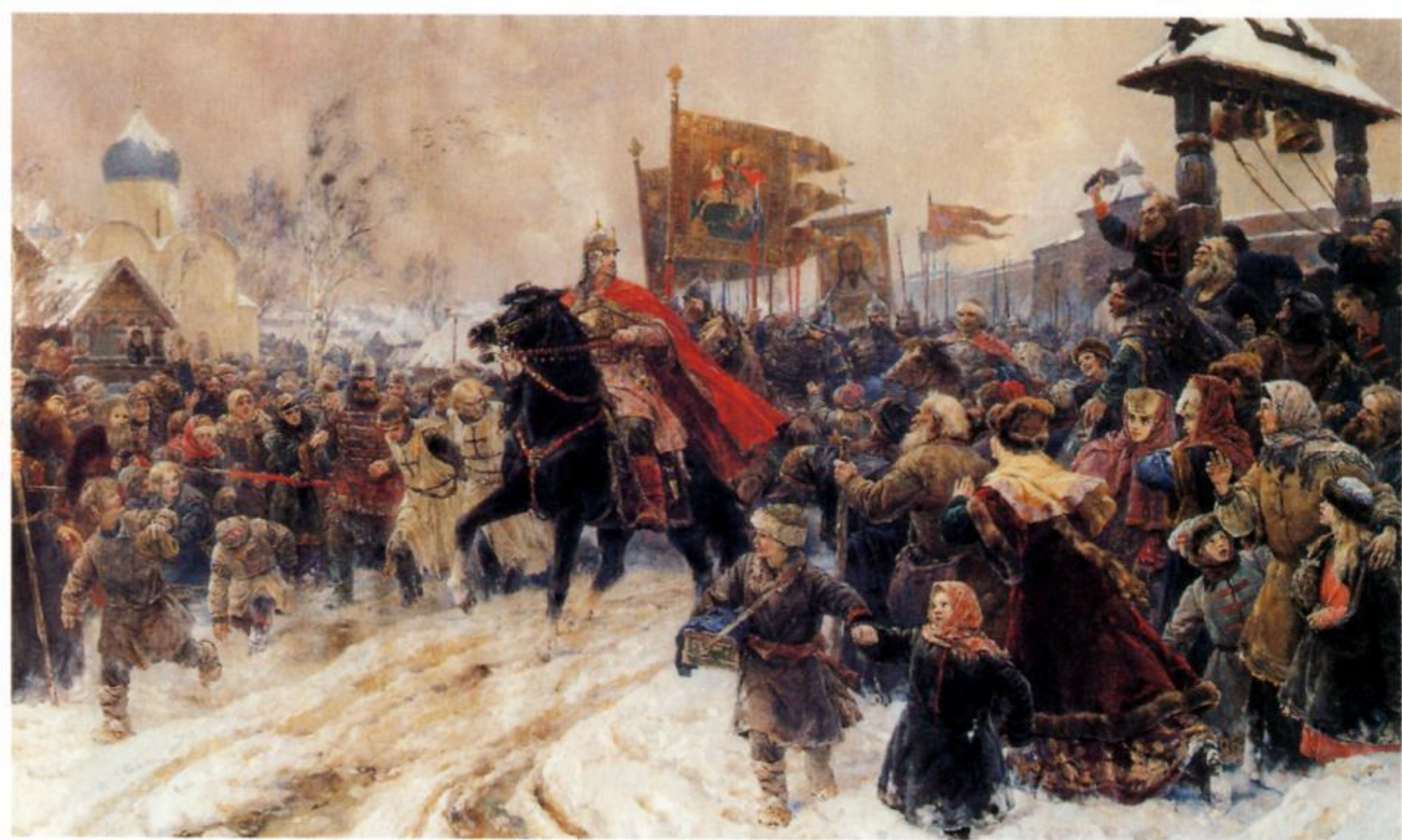
ВЛАДИМИР СЕРОВ Въезд Александра Невского во Псков после Ледового побоища. 1945

Холст, масло. 287 × 492 см Государственный Русский музей