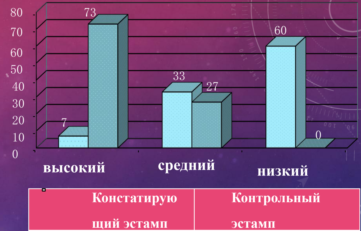
Риск. 6. Уровни развития эмпатии у обследуемых старших дошкольников под результатами констатирующего и контрольного этапа

27% детей проявляли переживание под поводу чувство другого, обращенность к внутреннему миру другого – средний уровень развития эмпатии. Под итогом контрольного исследования детей с низким уровнем развития эмпатии не было выявлено.