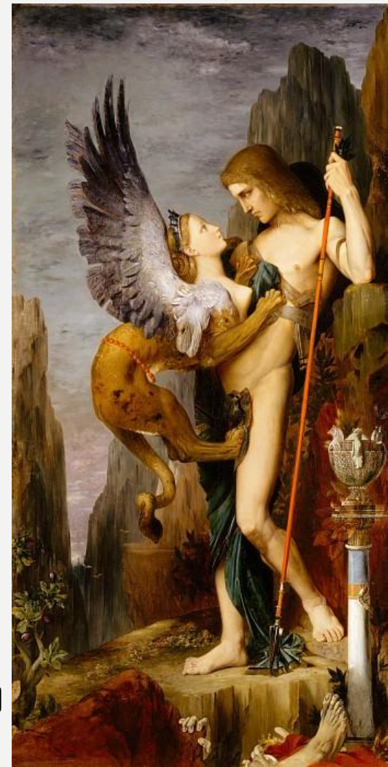
Эдип и Сфинкс (справа)