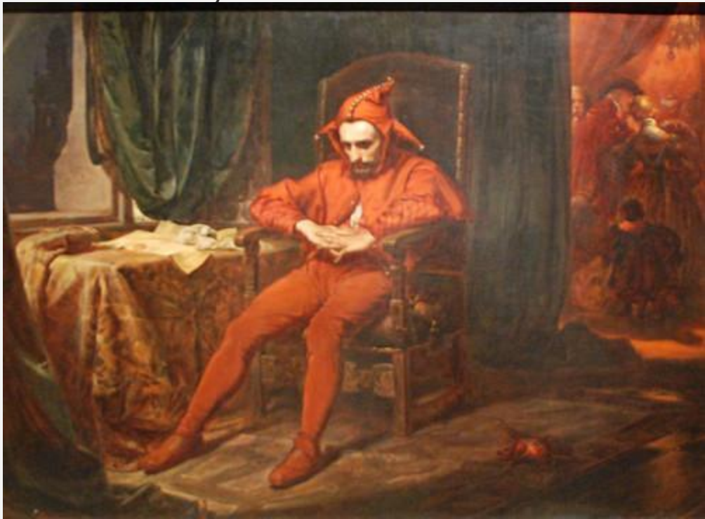
ЯН МАТЕЙКО «СТАНЧИК»