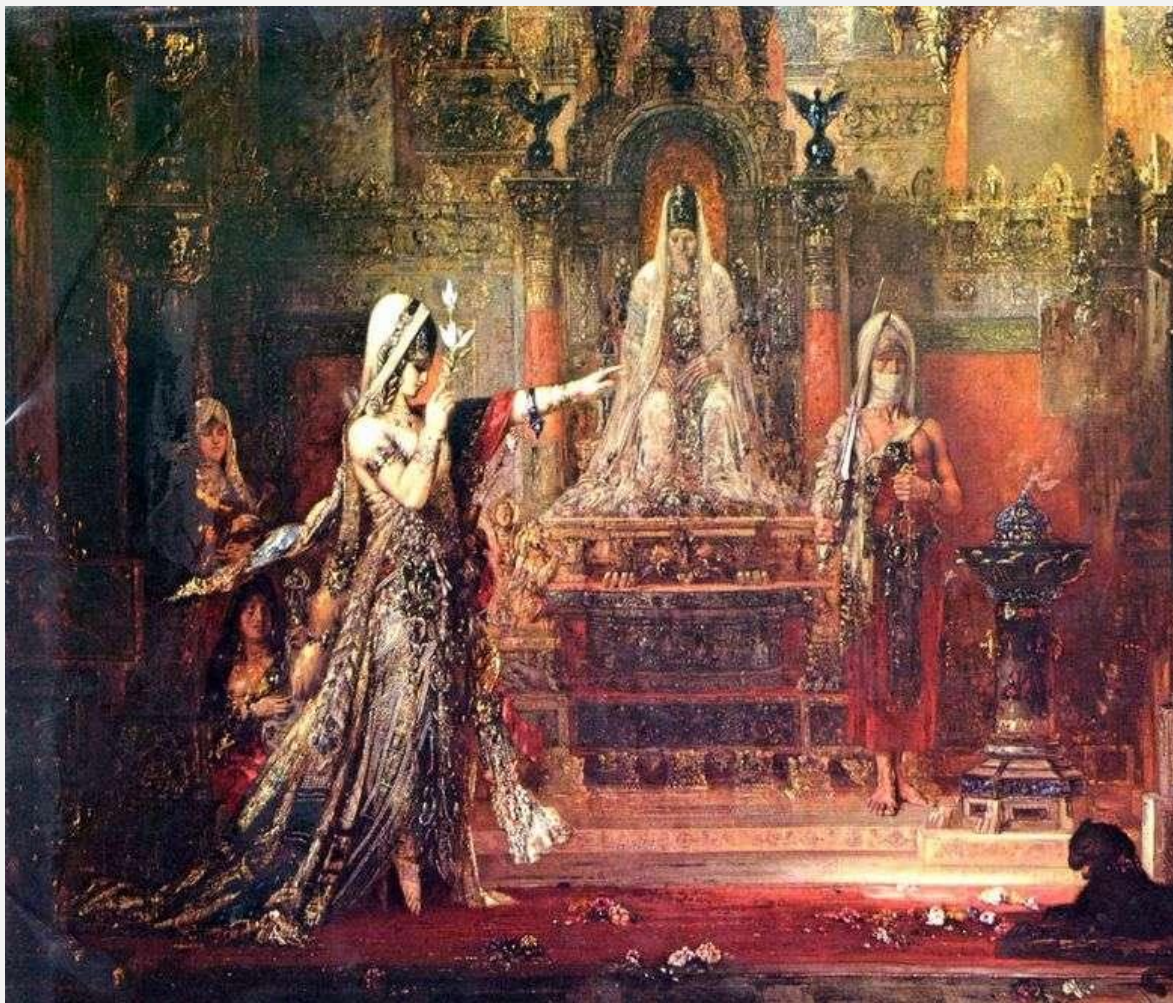
Саломея, танцующая перед Иродом (слева)