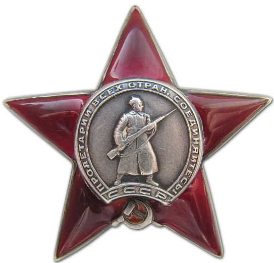
орден Красной Звезды