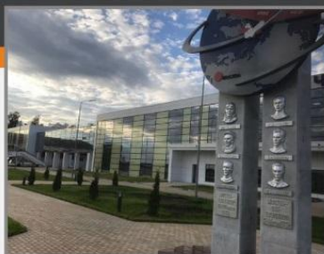
аэродром Чкаловский, г.Щелково