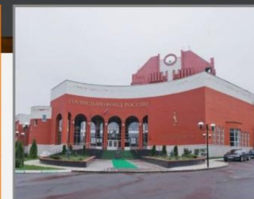
Госфильмофонд России, г.Домодедово