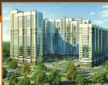
ЖК Изумрудные холмы, г.Зеленоград