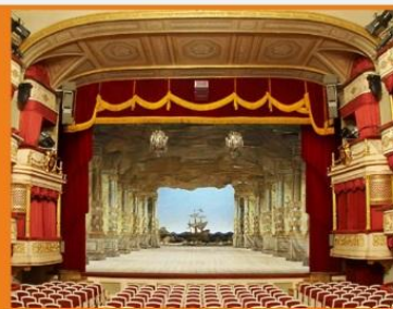
Государственный академический малый театр, г.Москва