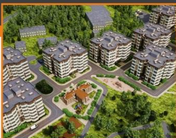
ЖК Квартал Европа, г.Балашиха