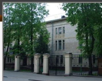
Посольство Ирака, г.Москва