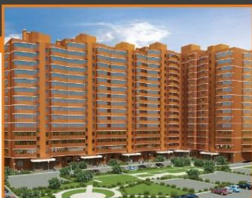
ЖК Новая Слобода, г.Ивантеевка