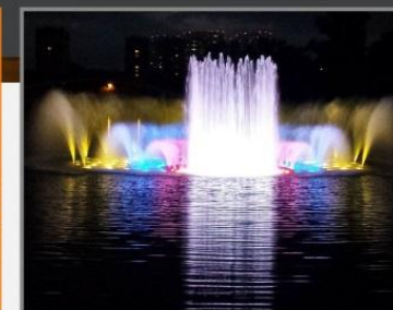
Фонтан Черкизовского пруда, г.Москва