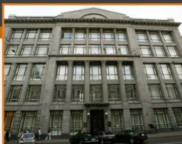
Министерство Финансов РФ, г.Москва