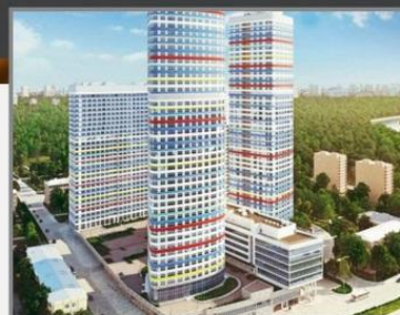
ЖК ТРИКОЛОР, г.Москва