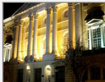
Главный военный клинический госпиталь им.Н.Н.Бурденко, г.Москва