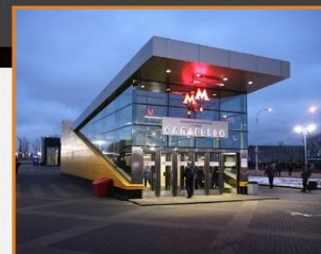
метро Саларьево, г.Москва