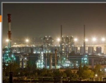
Московский нефтеперерабатывающий завод