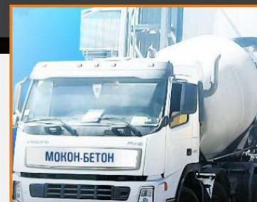
Завод МОКОН, филиал Мостотрест