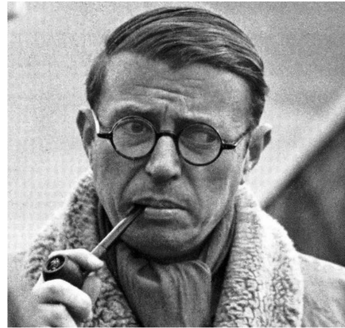
Жан-Поль Шарль Эмáр Сартр 1905-1980

Коэффициент сопротивления мира действиям человека – благоприятные и неблагоприятные ситуации.