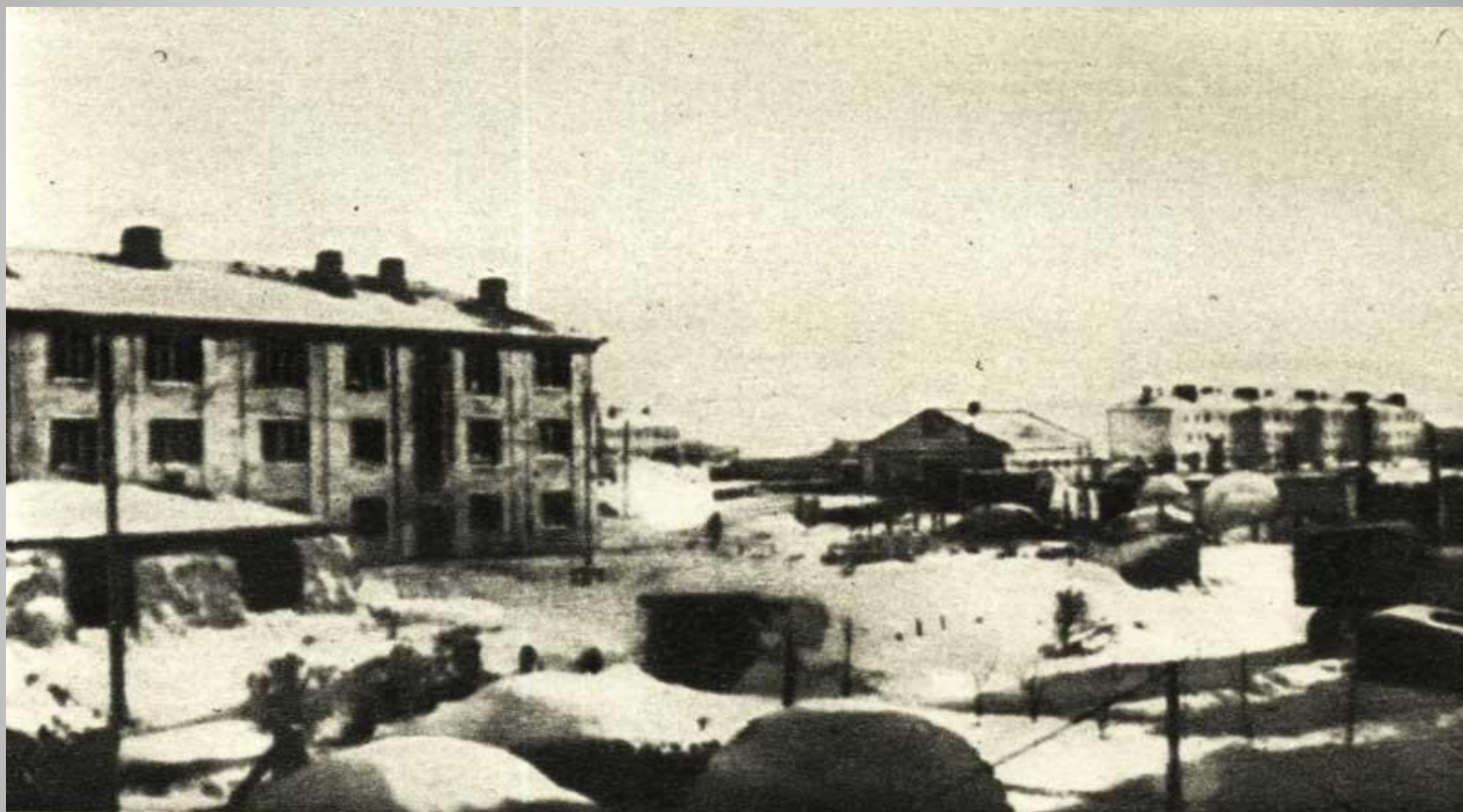
Сещинский авиагородок при немцах