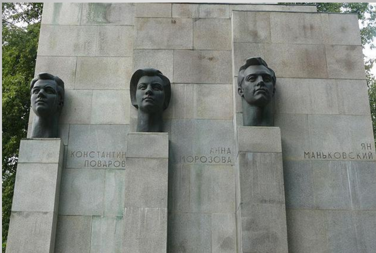
Памятник героям Сещинского интернационального подполья