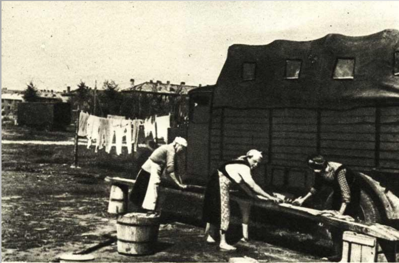
Работа Ани и её подруг в немецкой прачечной