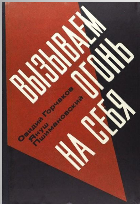
Горчаков, О. Вызываем огонь на себя / О.Горчаков, Я. Пшимановский. – М.: Молодая гвардия, 1967. – 344 с.

Повесть Овидия Горчакова и Януша Пшимановского «Вызываем огонь на себя» основана на реальных фактах.