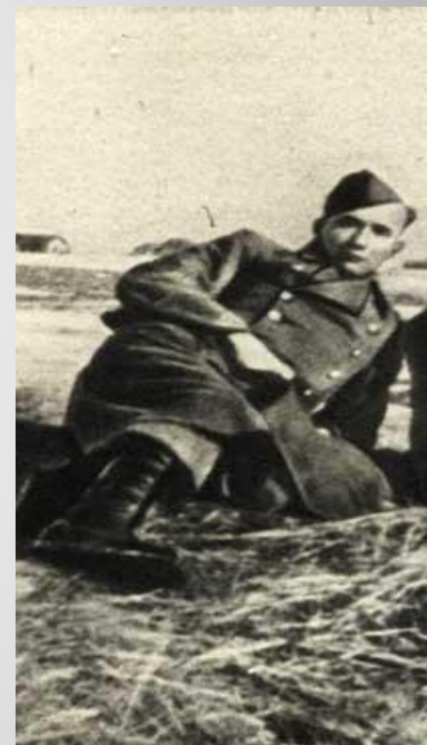
Гитлеровцы расстреляли героя польского народа Яна Маньковского

Немецкое командование понимало — в Сеще действует подполье. Гестапо удалось выявить отдельных членов группы, которые после пыток были казнены, но полностью разгромить группу Морозовой не получилось.