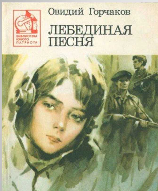
Горчаков, О. Лебединая песня / О.Горчаков. – М.: Воениздат, 1967. – 240 с.