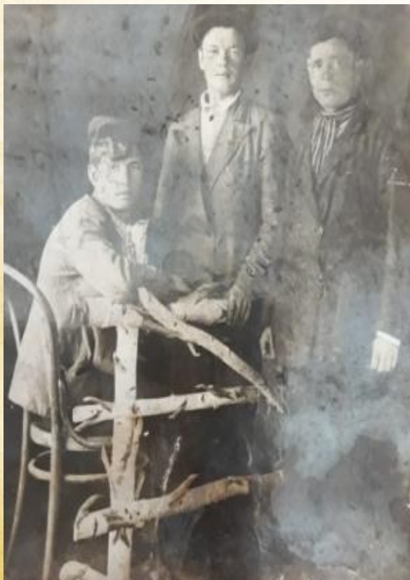
На фото в центре

После рождения дочери в 1940г. уезжает на заработки на Урал, на станцию Егоршино. Когда началась война, был призван Егоршинским РВК, Свердловской области.