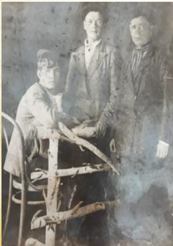
На фото в центре

После рождения дочери в 1940г. уезжает на заработки на Урал, на станцию Егоршино. Когда началась война, был призван Егоршинским РВК, Свердловской области.